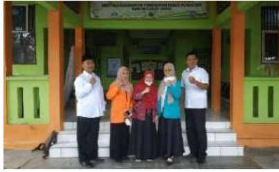
(Kunjungan DPL ke SMPN 3 Bumijawa)