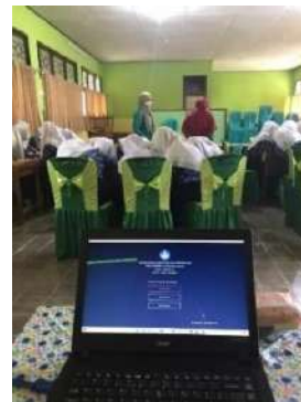
(Pelaksanaan AKM Kelas)