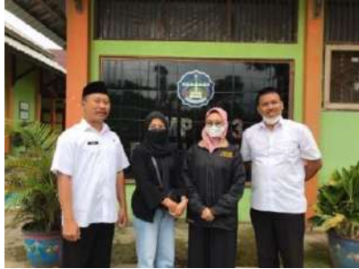
(Penerjunan secara langsung ke sekolah penempatan)