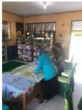
(Memperbarui data statistik perpustakaan)