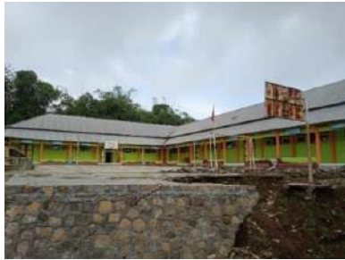
(Ruang kelas, dan halaman sekolah)