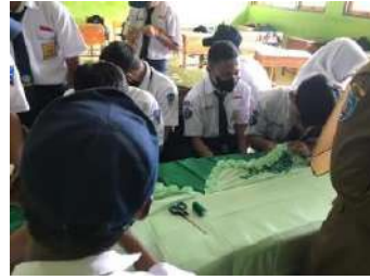
(Pendampingan Ujian Praktek Kelas IX)