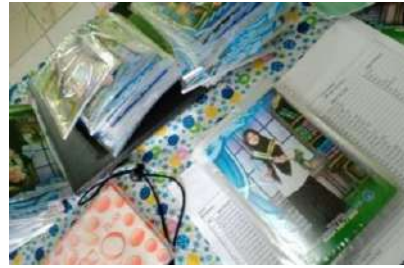
(Pembagian Foto Siswa)