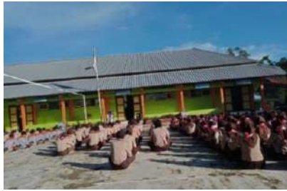
(Kegiatan Jum'at BERSERI)