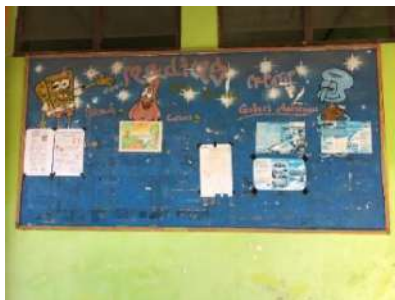
(Majalah Dinding di Depan Ruang Guru)