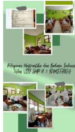
(Membantu pelajaran dan menata buku)