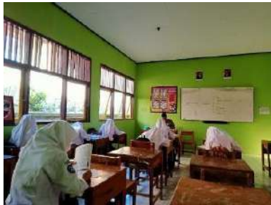
(Pembelajaran di kelas)