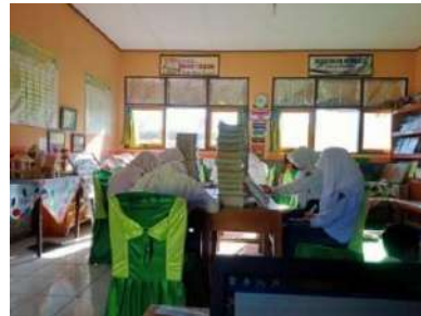
(Siswa membaca buku di perpustakaan)