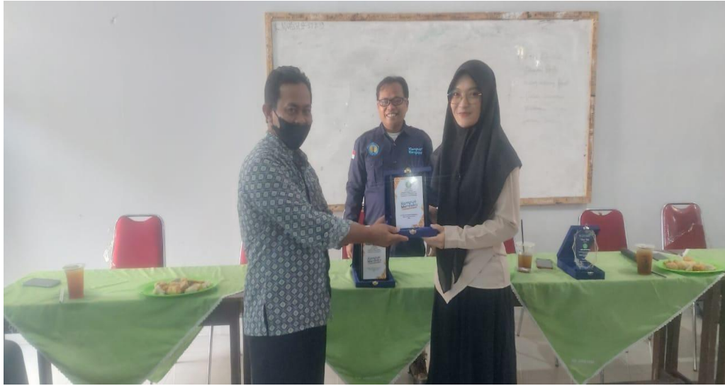
Pemberian kenang-kenangan dari SMP ANNIHAYAH untuk saya