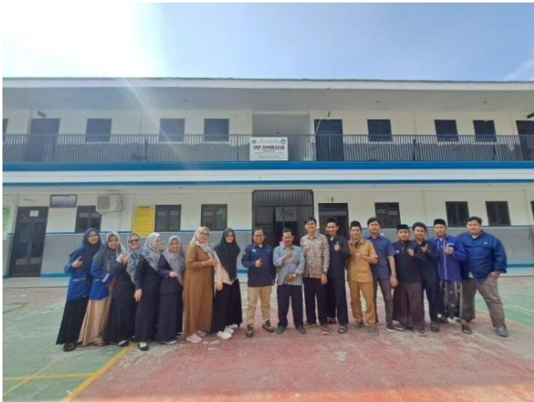
Foto bersama Bapak/Ibu guru SMP ANNIHAYAH