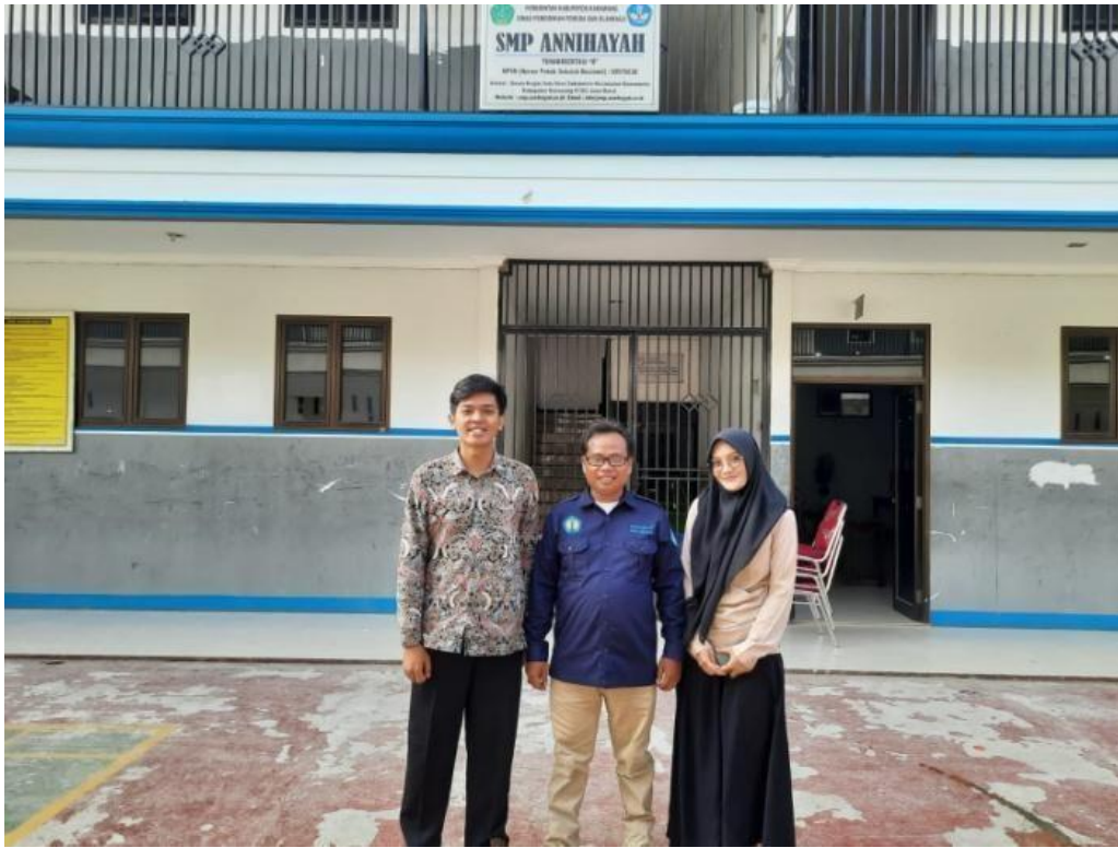
Foto bersama DPL