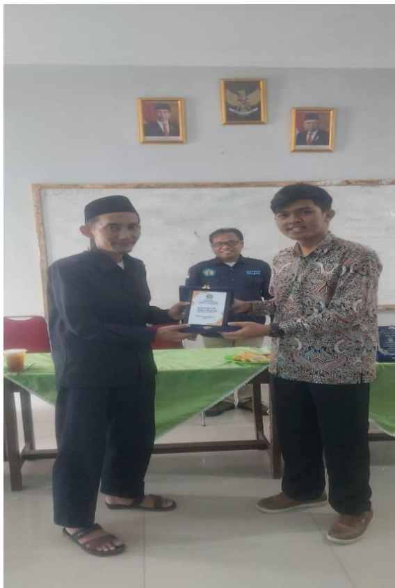
Pemberian kenang-kenangan dari SMP ANNIHAYAH untuk