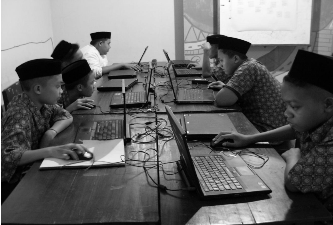
Asesmen Kompetensi Minimum (AKM)