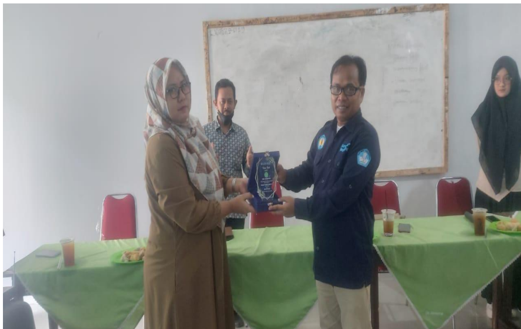
Pemberian kenang-kenangan dari mahasiswa untuk SMP ANNIHAYAH