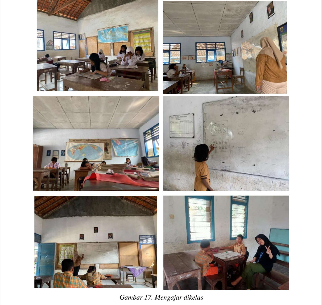
Gambar 17. Mengajar dikelas