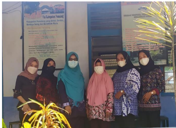
Gambar 2. Penerjunan di sekolah dengan Dosen Pembimbing Lapangan (DPL)