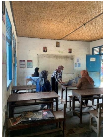
Gambar 5. Presentasi Rencana program Kampus Mengajar kepada guru