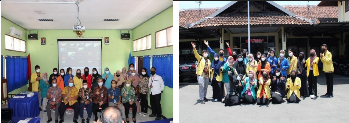
Gambar 1. Penerjunan perwakilan mahasiswa di Dinas Pendidikan Kabupaten Pemalang