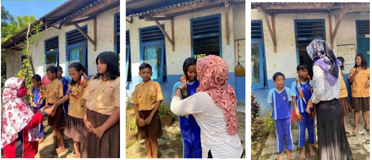
Gambar 4. Penyerahan hadiah dari guru kepada juara lomba olahraga