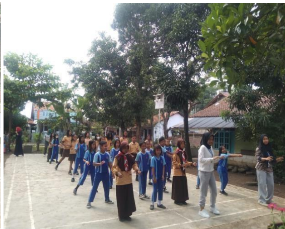
Gambar 10. Pelaksanaan senam pagi setiap hari Jum'at.