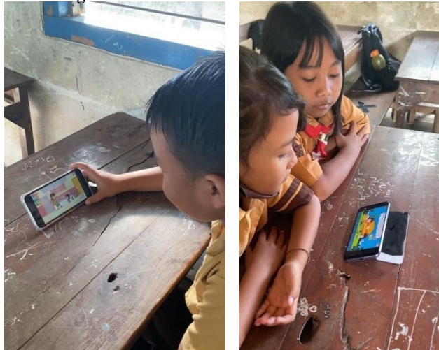
Gambar 15. Penyalan ulikasi mendongeng berbasis smartphone