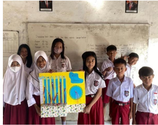
Gambar 8. Penerapan media pembelajaran papan diagram kelas 5