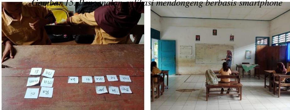
Gambar 16. Pelaksanaan kelas intensif