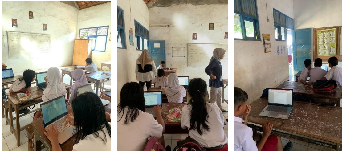
Gambar 12. Adaptasi teknologi kepada siswa kelas 4 dan 5