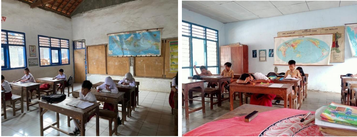
Gambar 11. Kegiatan mengajar