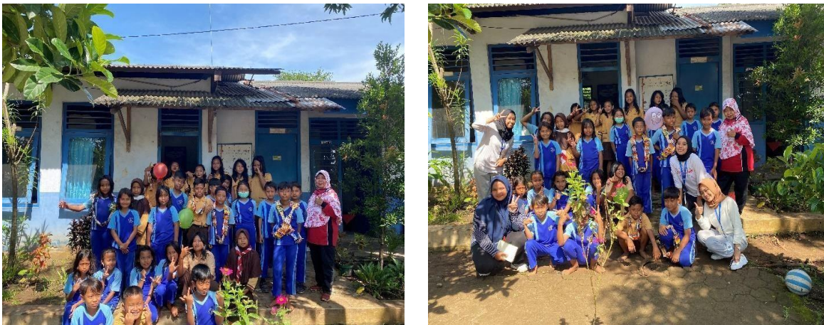
Gambar 3. Foto kegiatan lomba bersama siswa