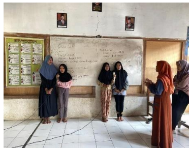
Gambar 18. Latihan pentas seni