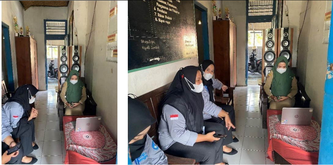
Gambar 6. Webinar Asesmen literasi dan numerasi dengan guru wali kelas 5