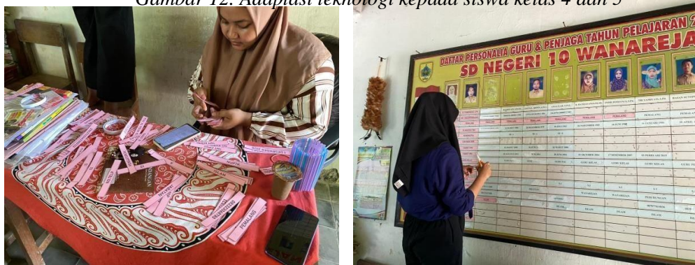
Gambar 13. Pemasangan biodata guru di papan statistik sekolah