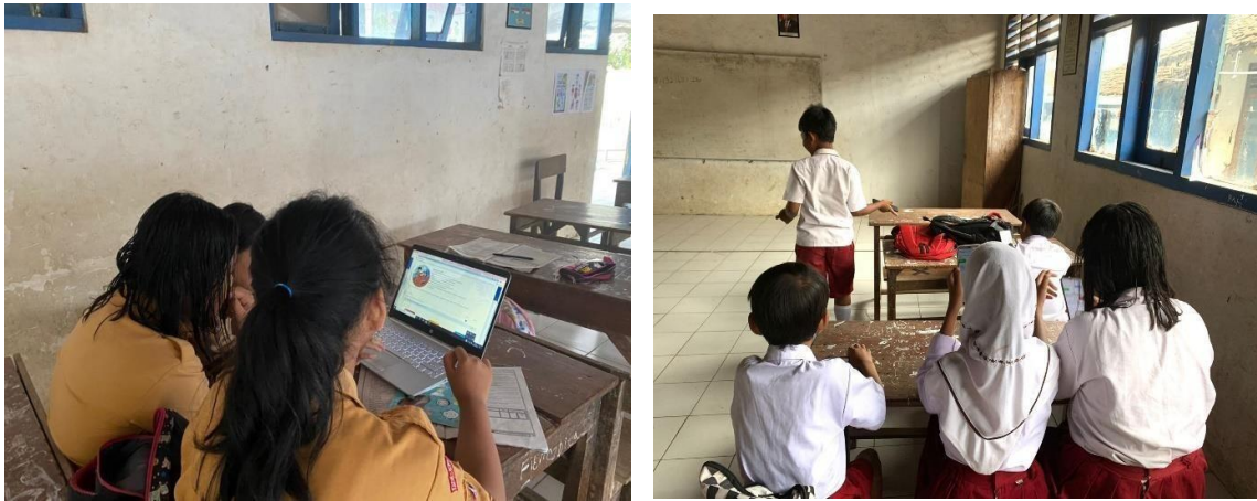
Gambar 7. Pelaksanaan simulasi AKM (kiri), pelaksanaan AKM (kanan) siswa kelas 5