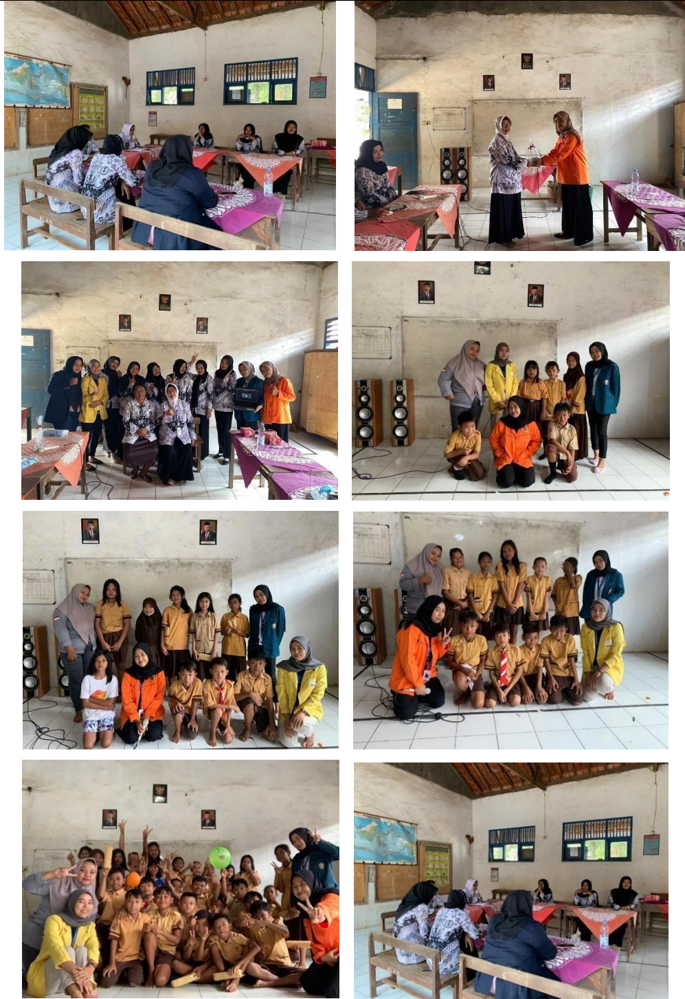
Gambar 20. Perpisahan dengan murid dan guru.