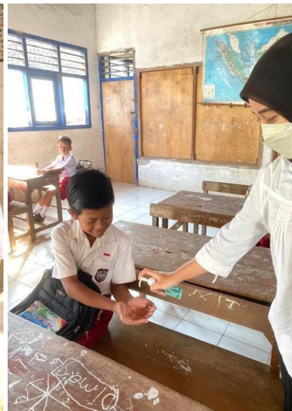
Gambar 9. Penerapan Covid-19 campaign