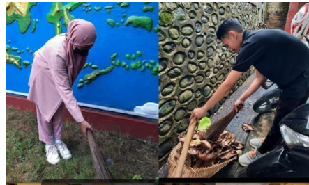
Bersih bersih kelas dan lingkungan sekolah