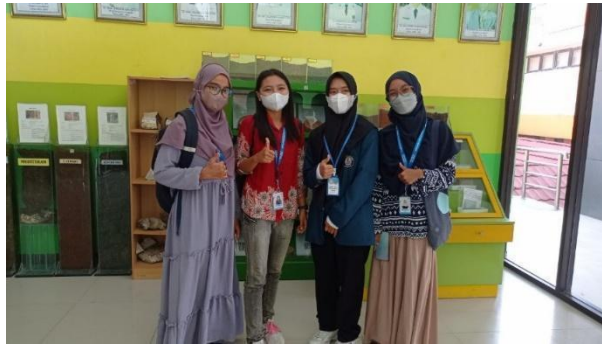
Gambar 55. Mengajukan proposal ke Dinas Perpustakaan dan Kearsipan Daerah Kabupaten Gunungkidul.