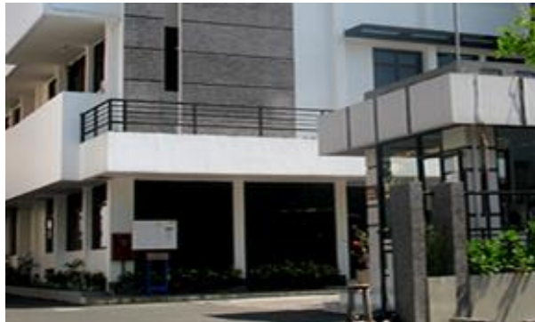
Gambar 57. Mengajukan proposal ke PT. Intan Pariwara.