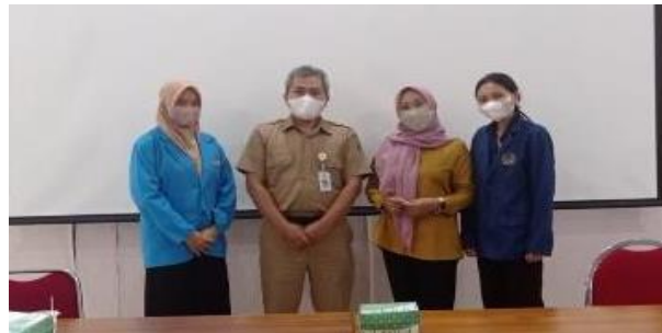
Gambar 1 Koordinasi dengan Dinas Pendidikan Kabupaten Gunungkidul.