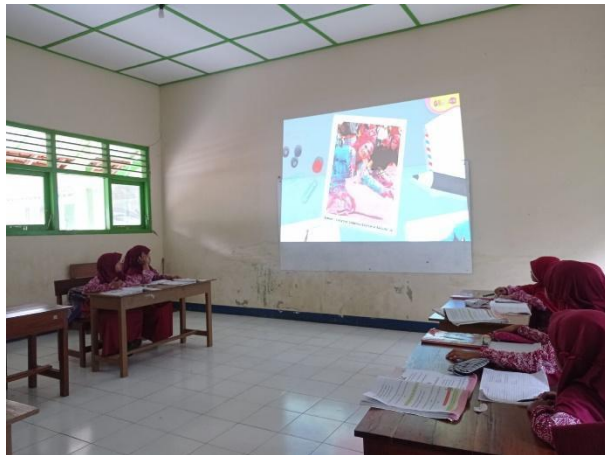
Gambar 48. Menampilkan video kebhinnekaan di seluruh kelas.