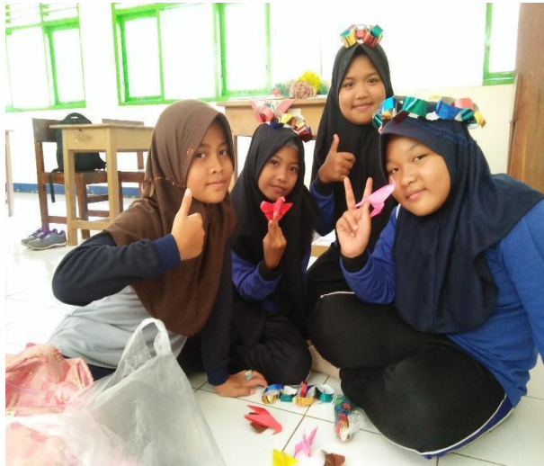
Gambar 68. Kegiatan meronce di seluruh kelas.