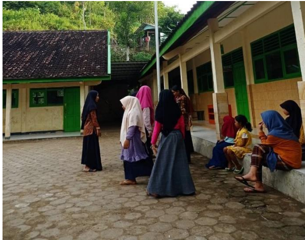
Gambar 47. Latihan upacara dengan siswa kelas III, IV, dan V.