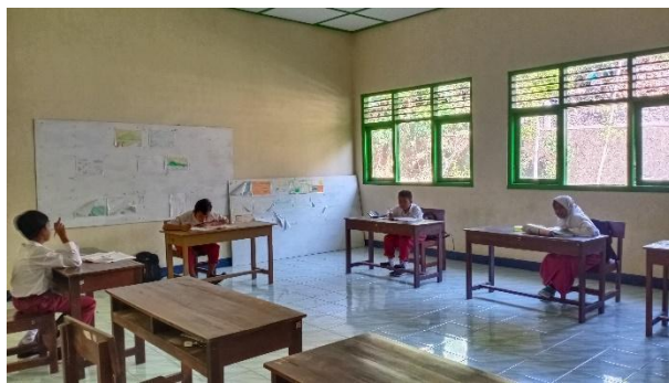
Gambar 52. Membantu mengajar di kelas.