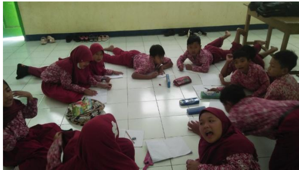
Gambar 18. Literasi di kelas rendah.