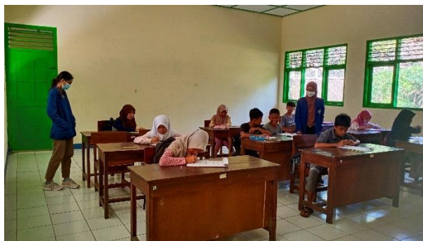
Gambar 10. Membantu mengajar di kelas.