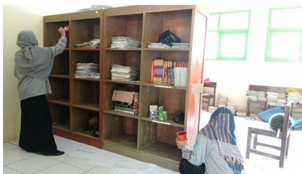
Gambar 74. Pengecatan rak buku perpustakaan.