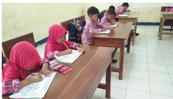
Gambar 32. Lomba mewarnai kaligrafi kelas rendah.