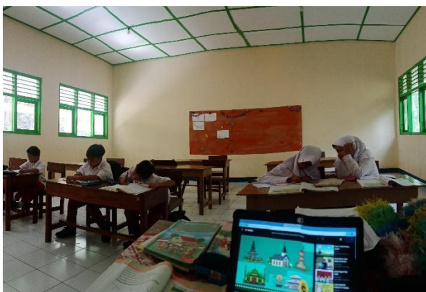
Gambar 71. Membantu mengajar di kelas.