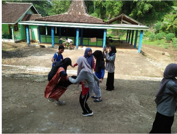
Gambar 42. Outbound kelas VI.