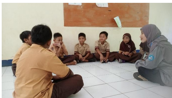
Gambar 13. Literasi di kelas III.