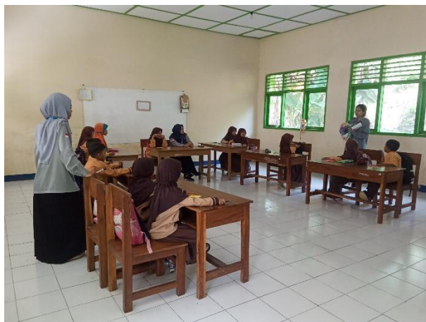
Gambar 73. Kegiatan meronce di seluruh kelas.