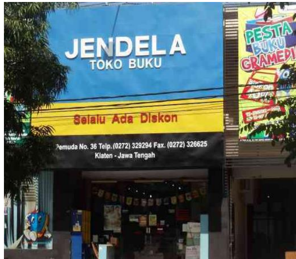
Gambar 56. Mengajukan proposal ke toko buku Jendela.