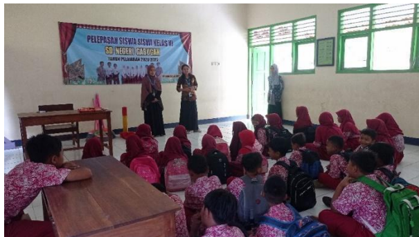
Gambar 82. Pembagian hadiah dan perpisahan dengan seluruh siswa.