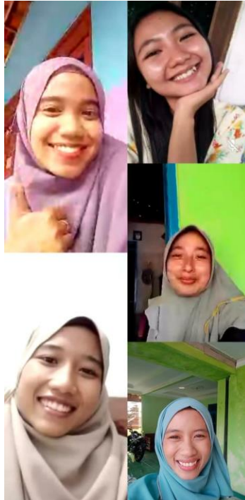
Gambar 43. Halal bihalal dengan keluarga Gabugan secara virtual.