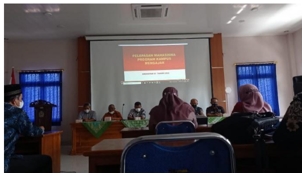
Gambar 2 Penerjunan mahasiswa Kampus Mengajar 3 oleh Dinas Pendidikan Kabupaten Gunungkidul.