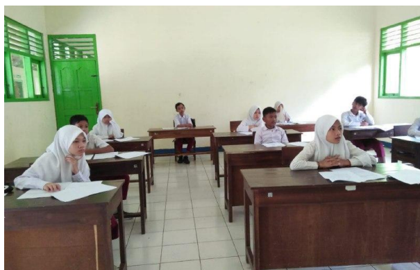
Gambar 54. Pemetaan di kelas VI.