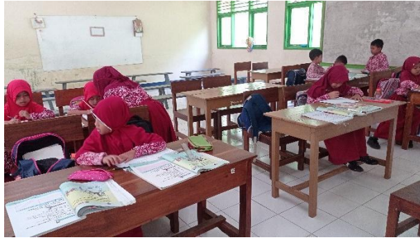
Gambar 17. Membantu mengajar di kelas.