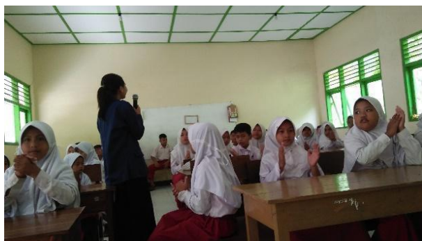
Gambar 15. Menanamkan pendidikan karakter.