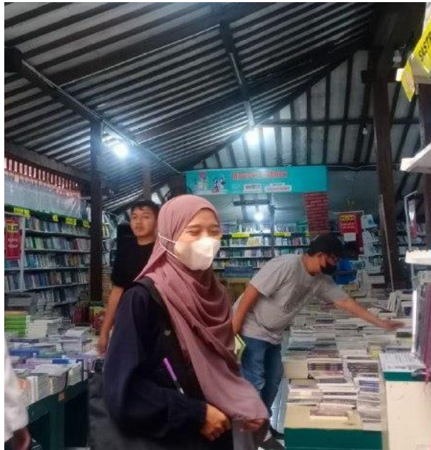
Gambar 58. Mengajukan proposal ke Togamas.