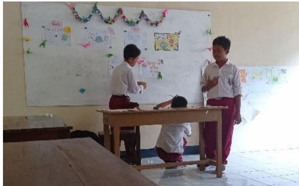
Gambar 79. Membantu menghias kelas dengan hasil meronce di seluruh kelas.