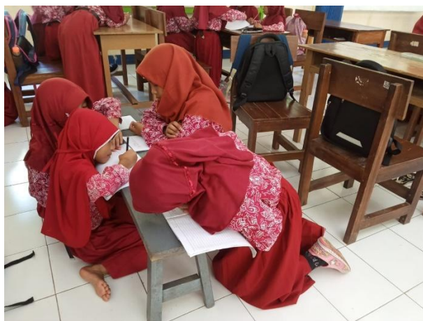
Gambar 16. Literasi membuat puisi.