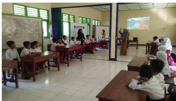
Gambar 34. Pelaksanaan pesantren kilat.