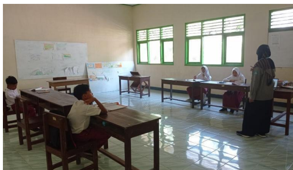
Gambar 22. Membantu mengajar di kelas.