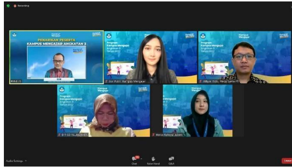
Gambar 87. Mengikuti seremonial penarikan mahasiswa KM3.