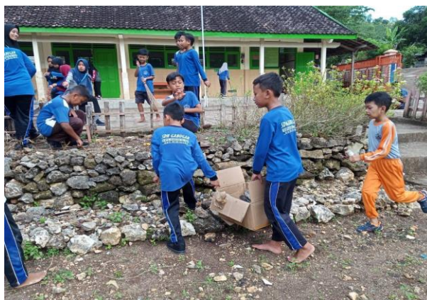
Gambar 24. Kerja bakti membersihkan lingkungan sekolah.