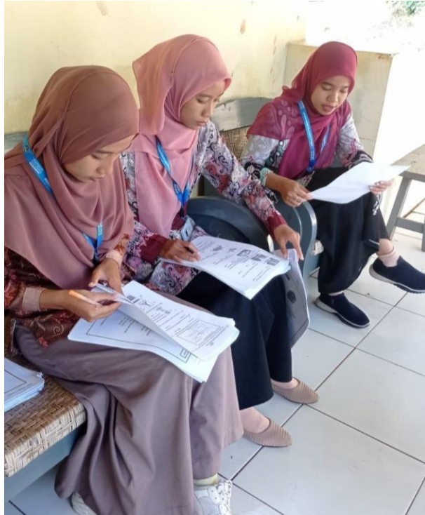
Gambar 78. Membantu mengoreksi jawaban PAT siswa.