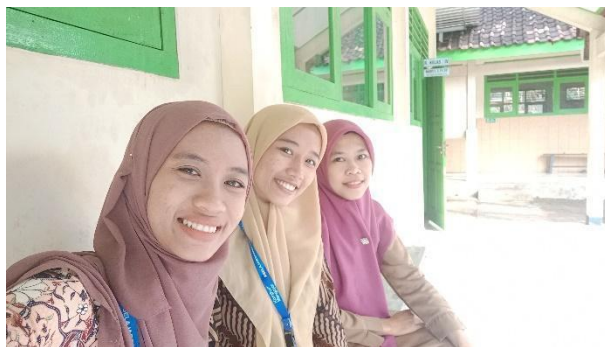
Gambar 70. Koordinasi dengan proktor sekolah SD Negeri Gabugan.