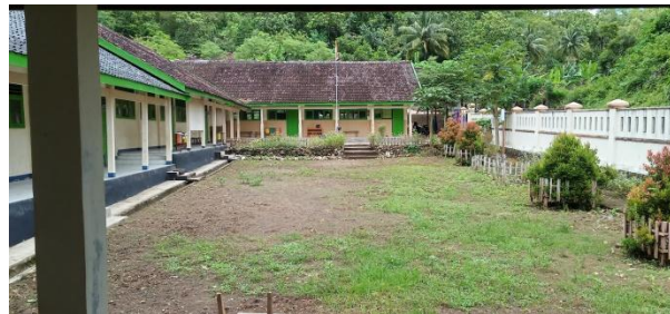
Gambar 4 Observasi awal di SD Negeri Gabugan.