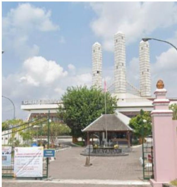
Gambar 59. Mengajukan proposal ke Dinas Perpustakaan dan Arsip Daerah DIY.