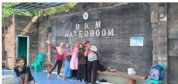
Gambar 76. Mendampingi tour siswa kelas VI.