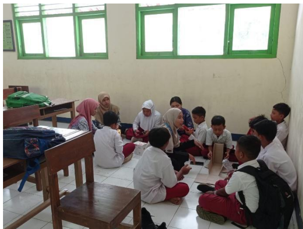
Gambar 51. Kegiatan meronce di seluruh kelas.