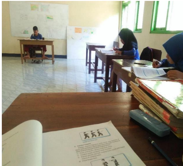
Gambar 65. Membantu mengajar di kelas.