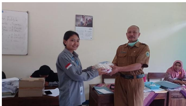
Gambar 86. Penyerahan kenang-kenangan dari mahasiswa KM3.