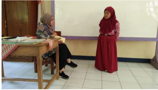
Gambar 36. Literasi mengenai surat pendek dan doa sehari-hari.