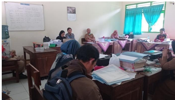
Gambar 85. Pamitan mahasiswa KM3 kepada bapak ibu guru SD Negeri Gabungan.