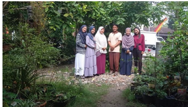
Gambar 89. Silaturahmi dan tanda tangan berita acara serah terima barang.