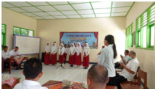
Gambar 81. Pelepasan siswa kelas VI.