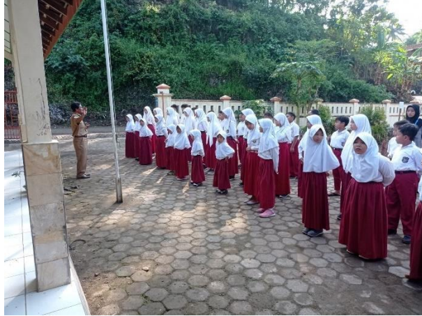
Gambar 46. Apel pagi halal bihalal seluruh warga SD Negeri Gabungan.