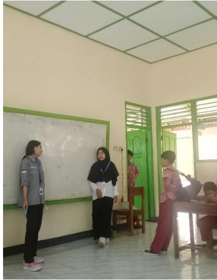
Gambar 26. Pemberian kuis setelah jam pelajaran.