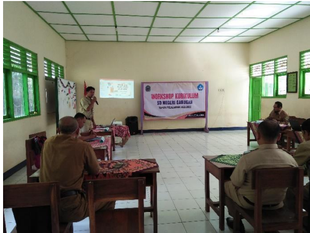
Gambar 84. Workshop kurikulum SD Negeri Gabungan.