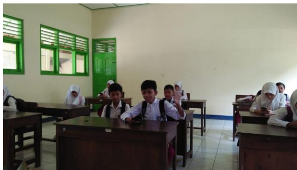
Gambar 35. Pembahasan soal Try Out kelas VI.