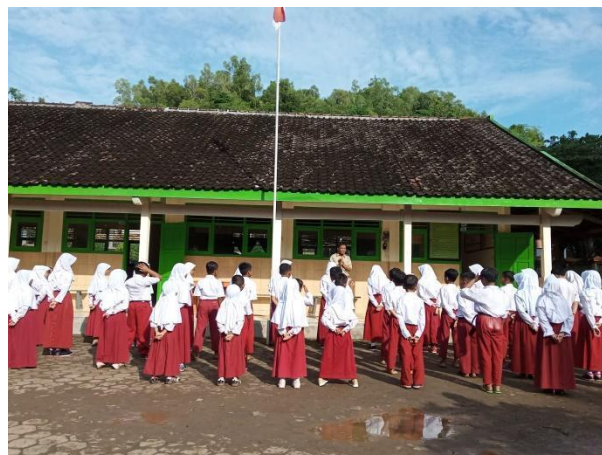
Gambar 6. Apel pagi perkenalan dengan seluruh siswa.