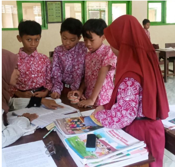
Gambar 37. Membantu mengajar di kelas.