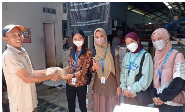
Gambar 61. Mengambil buku donasi dari Gudang BUku Raja Murah.