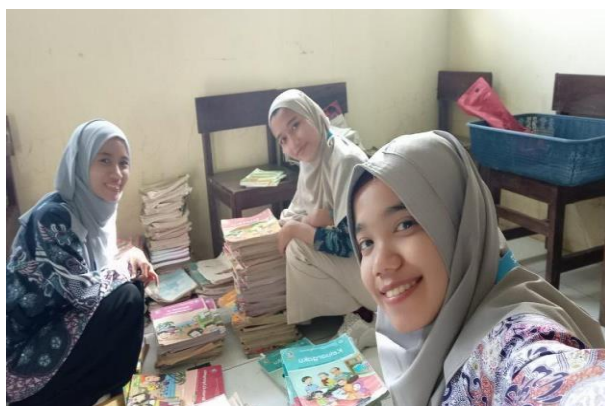
Gambar 63. Pengelompokkan buku perpustakaan sekolah.