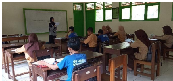
Gambar 29. Bedah soal ASPD IPA di kelas VI.