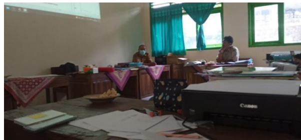
Gambar 5 Perkenalan dengan bapak ibu guru SD Negeri Gabugan.