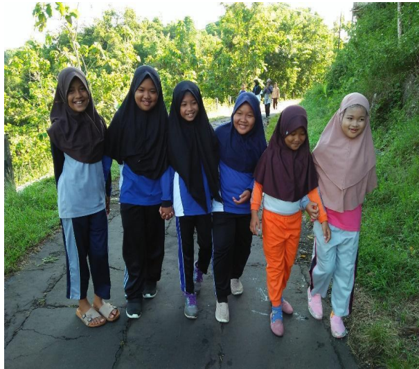
Gambar 67. Jumat sehat dengan jalan santai.