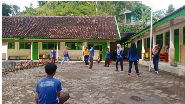
Gambar 53. Olahraga bersama dengan siswa kelas VI.