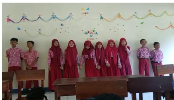
Gambar 77. Membantu melatih paduan suara dan baca puisi kelas VI.