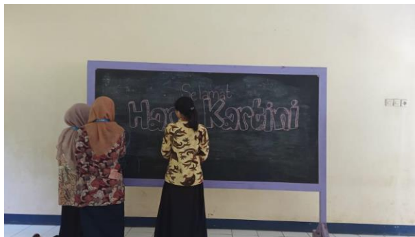
Gambar 38. Persiapan memperingati hari Kartini.