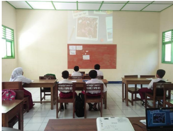
Gambar 50. Menampilkan video kebhinnekaan di seluruh kelas.