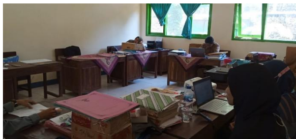
Gambar 30. Forum Koordinasi dan Komunikasi Sekolah (FKKS) KM3.