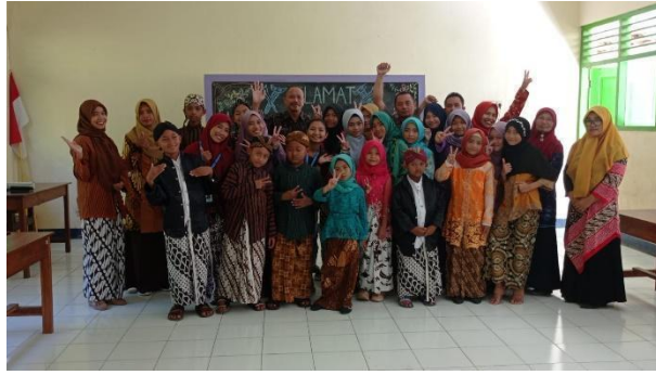
Gambar 39. Pelaksanaan lomba memperingati hari Kartini.