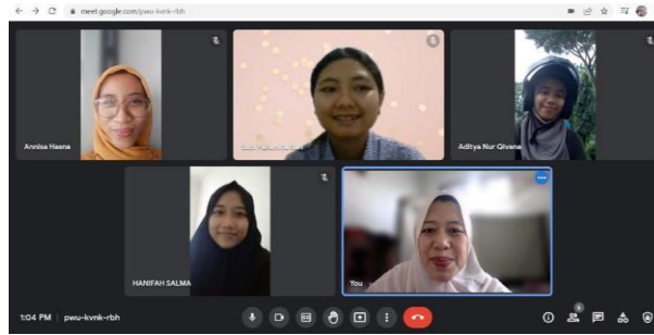
Gambar 3 Koordinasi dengan Dosen Pembimbing Lapangan.