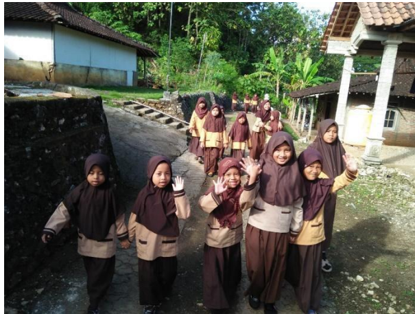
Gambar 49. Jalan sehat bersama seluruh siswa.