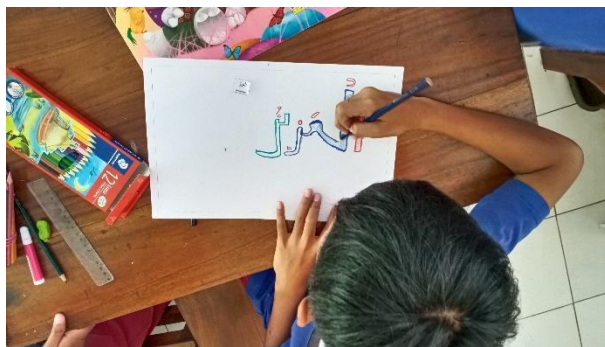
Gambar 33. Lomba menggambar kaligrafi kelas tinggi.