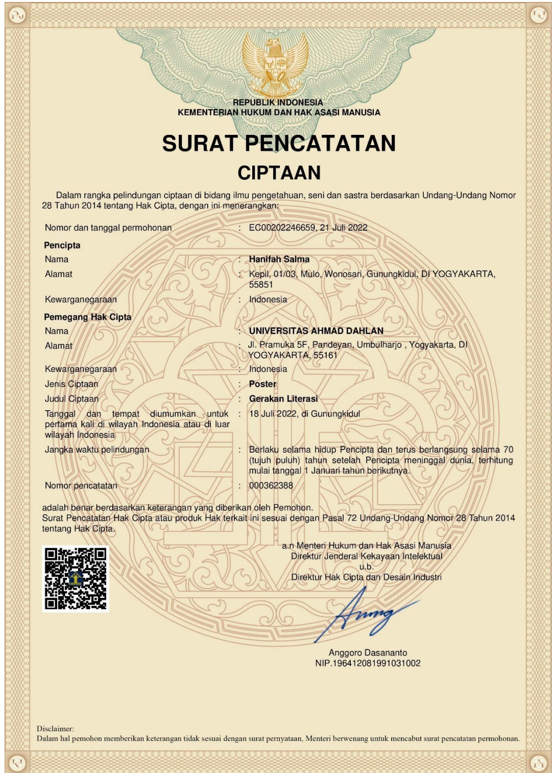
Gambar 90 Sertifikat hak cipta poster