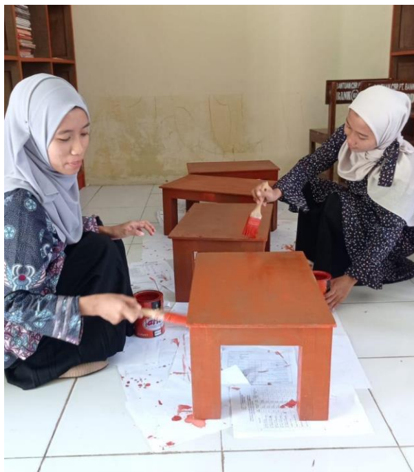
Gambar 75. Pengecatan meja baca perpustakaan.