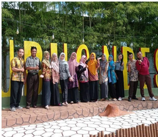
Gambar 66. Rapat sekolah SD Negeri Gabungan.