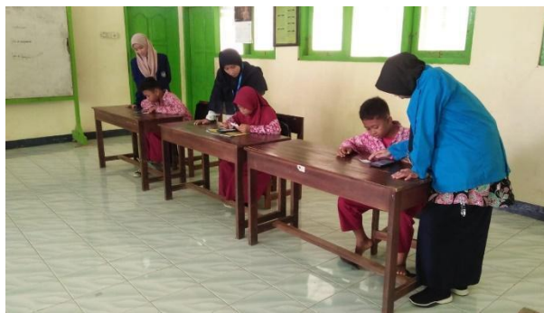
Gambar 23. Pelaksanaan AKM Kelas literasi di kelas V.