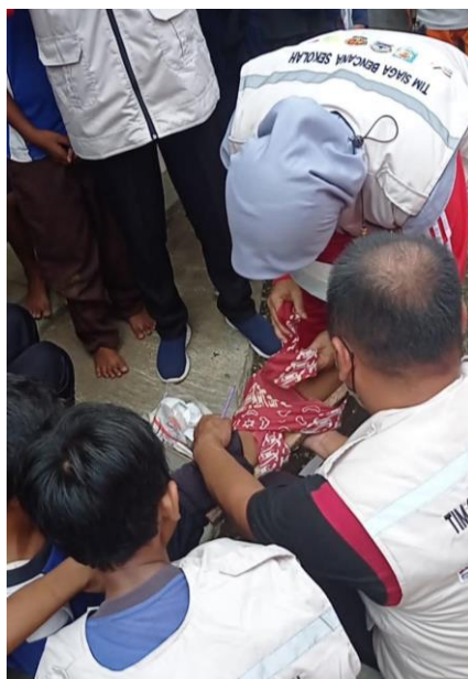
Gambar 21. Simulasi siaga bencana banjir genangan oleh Bintari Foundation.