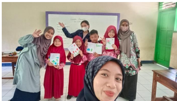
Gambar 7. Membantu mengajar di kelas.