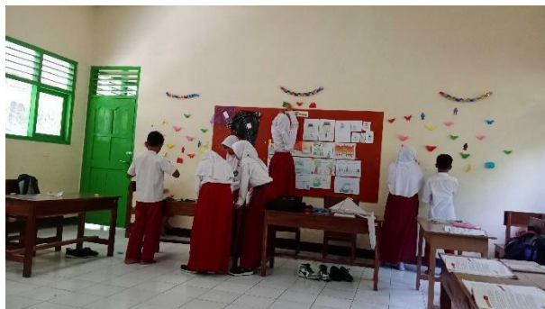
Gambar 69. Membantu menghias dengan hasil meronce di seluruh kelas.