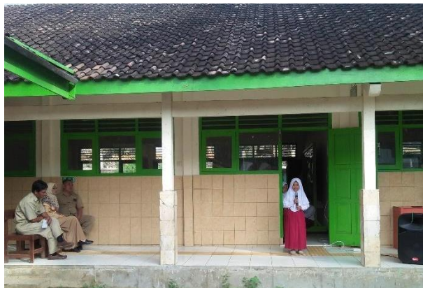
Gambar 40. Lomba sholawat dan pildacil.