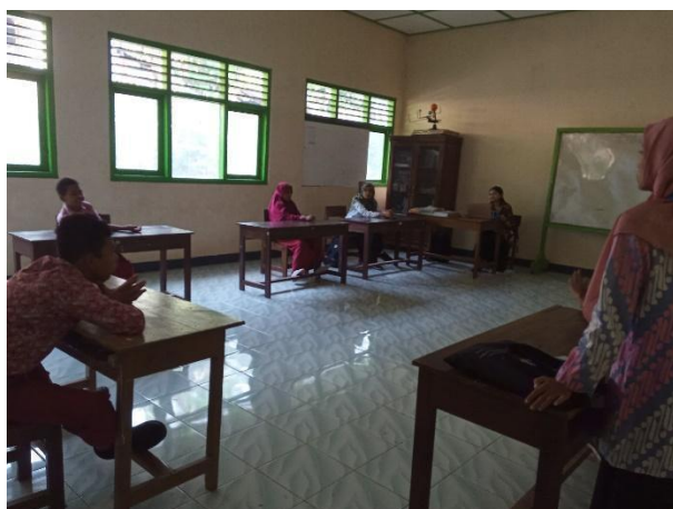
Gambar 72. Pelaksanaan post tes AKM Kelas di kelas V.