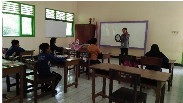
Gambar 28. Membantu mengajar di kelas.