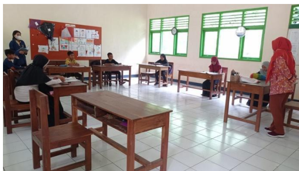
Gambar 8. Observasi lanjutan SD Negeri Gabugan.