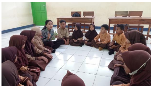
Gambar 12. Literasi di kelas I dan II.