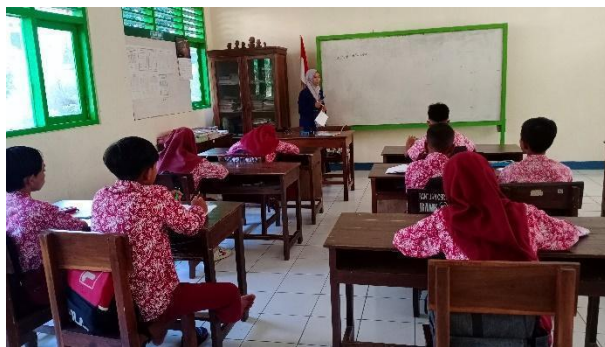
Gambar 20. Bedah soal PTS Matematika di kelas VI.