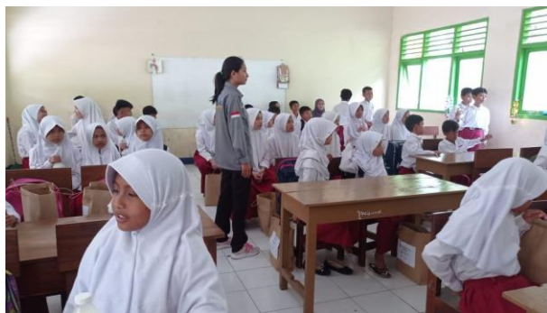
Gambar 14. Gerakan minum susu oleh tim Yayasan Gemilang dan Dompot Dhuafa.