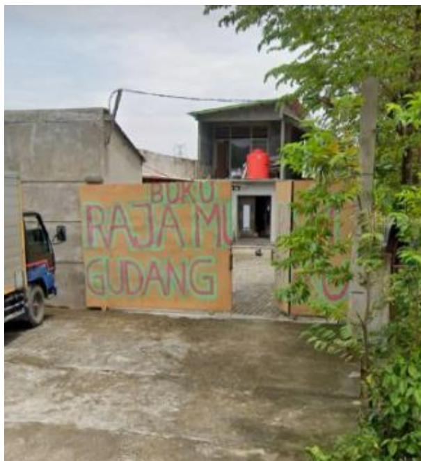
Gambar 60. Mengajukan proposal ke Gudang Buku Raja Murah.