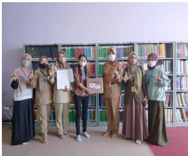
Gambar 62. Pengambilan buku donasi dari Dinas Perpustakaan dan Kearsipan Daerah Kabupaten Gunungkidul.