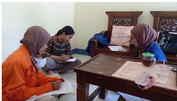
Gambar 11. Membantu mengoreksi jawaban PTS siswa