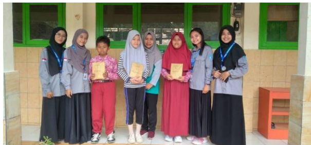
Gambar 41. Pemberian hadiah lomba Ramadhan Festival Gabugan Elementary School.