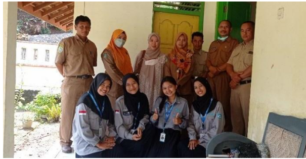
Gambar 80. Kunjungan Dosen Pembimbing Lapangan.