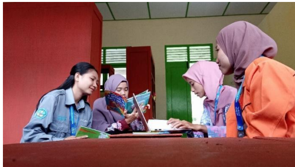
Gambar 83. Pendataan buku donasi.