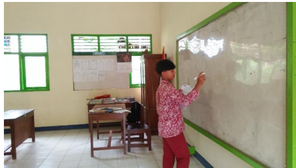
Gambar 27. Bedah soal ASPD Matematika di kelas VI.