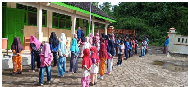
Gambar 9. Jumat sehat dengan jalan sehat.