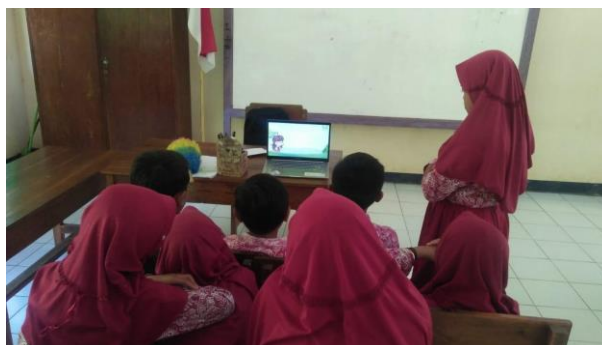
Gambar 31. Membantu mengajar di kelas dengan memanfaatkan platform digital.