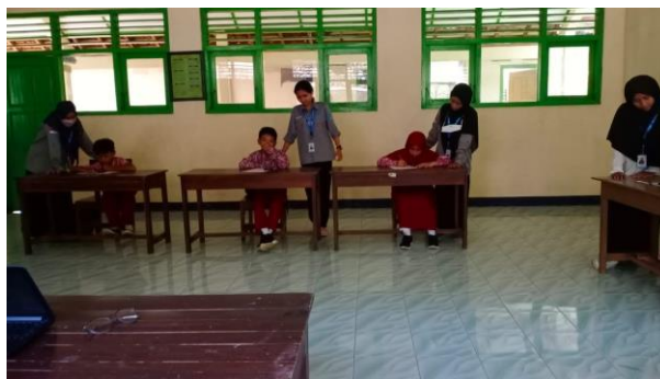
Gambar 25. Pelaksanaan AKM Kelas numerasi di kelas V.