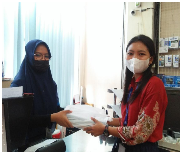
Gambar 64. Pengambilan donasi buku dari toko buku Jendela.