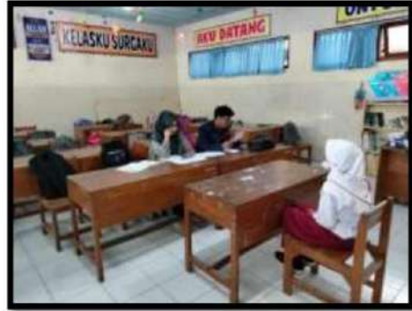
Dokumentasi Kegiatan 26 April 2022