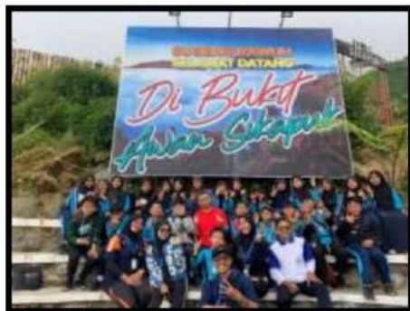
Dokumentasi Kegiatan 01 April 2022