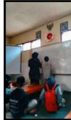
Dokumentasi Kegiatan 24 Maret 2022