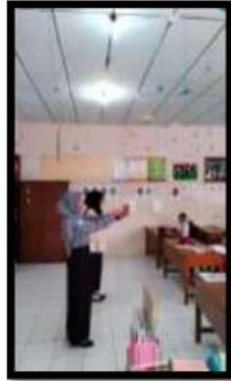
Dokumentasi Kegiatan 25 April 2022