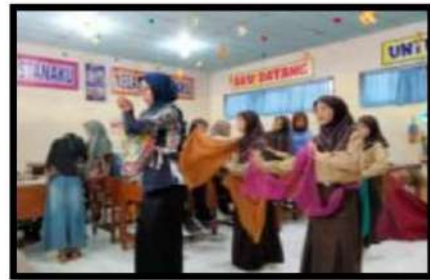
Dokumentasi Kegiatan 14 Mei 2022