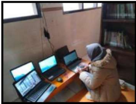
Dokumentasi Kegiatan 23 Maret 2022