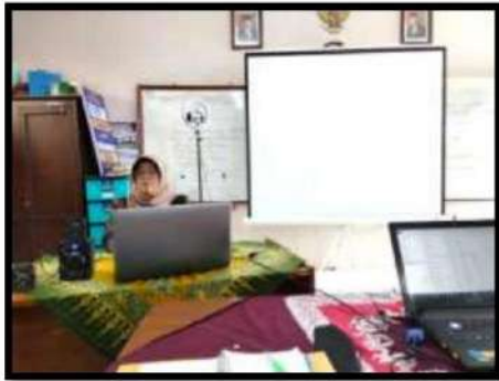
Dokumentasi Kegiatan 18 April 2022