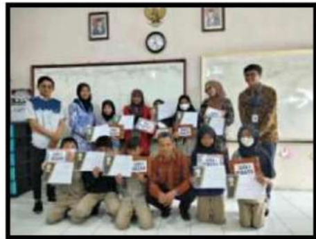
Dokumentasi Kegiatan 28 April 2022