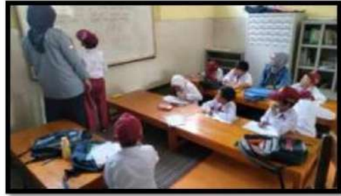
Dokumentasi Kegiatan 29 Maret 2022