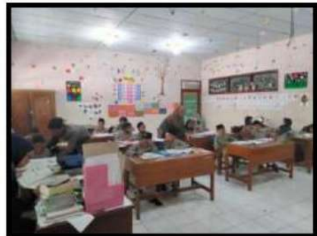
Dokumentasi Kegiatan 12 Mei 2022