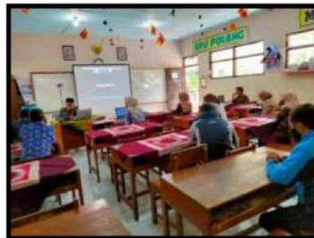
Dokumentasi Kegiatan 09 April 2022