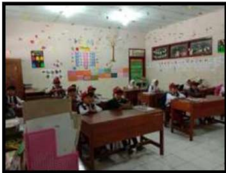
Dokumentasi Kegiatan 27 April 2022