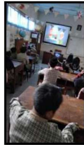
Dokumentasi Kegiatan 07 2022