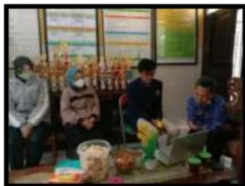
Kegiatan Penerjunan di SDN 1 Parikesit bersama DPL