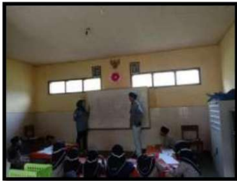
Dokumentasi Kegiatan 16 Maret 2022