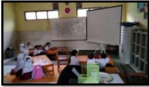
Dokumentasi Kegiatan 21 Maret 2022