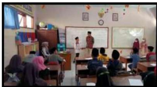
Dokumentasi Kegiatan 13 April 2022