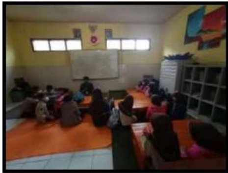
Dokumentasi Kegiatan 18 Maret 2022