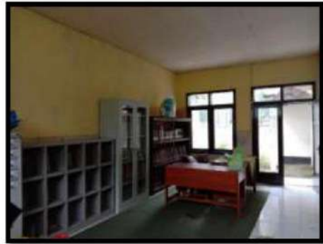
Dokumentasi Kegiatan 19 April 2022