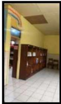
Dokumentasi Kegiatan 20 April 2022