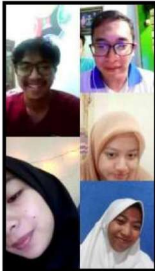
Diskusi daring terkait teknis pelaksanaan kegiatan observasi