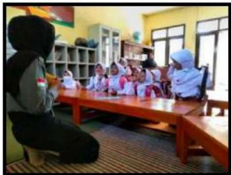
Dokumentasi Kegiatan 11 April 2022