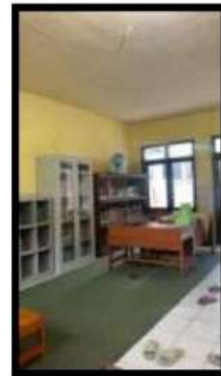
Dokumentasi Kegiatan 21 April 2022