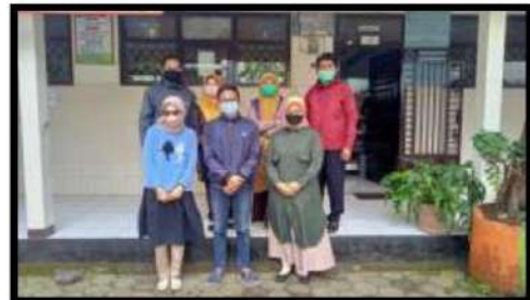
Penyampaian program kerja kepada guru dan kepala sekolah