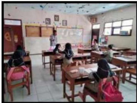
Dokumentasi Kegiatan 11 Mei 2022