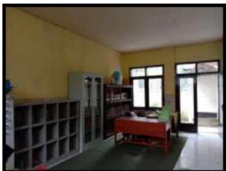
Dokumentasi Kegiatan 09 Maret 2022