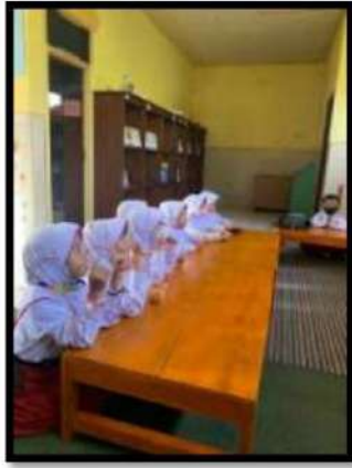
Dokumentasi Kegiatan 14 Maret 2022