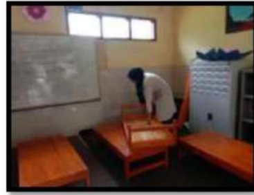
Dokumentasi Kegiatan 22 Maret 2022