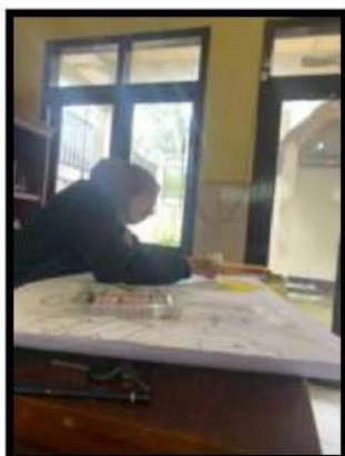
Dokumentasi Kegiatan 11 Maret 2022