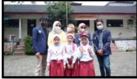
Kegiatan wawancara bersama guru dan beberapa siswa