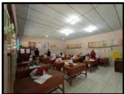
Pengamatan Kegiatan Belajar Mengajar