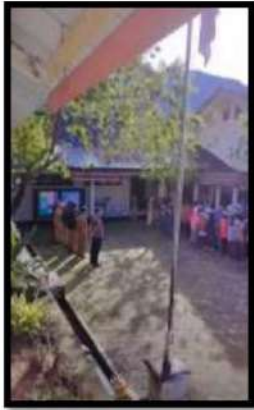
Dokumentasi Kegiatan 09 Mei 2022