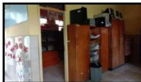
Keadaan Lingkungan Perpustakaan