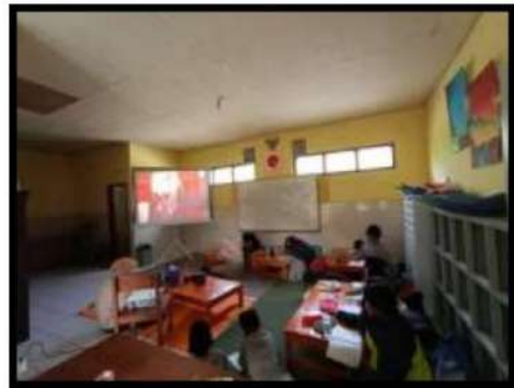
Dokumentasi Kegiatan 31 Maret 2022