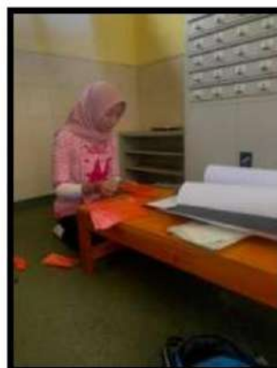
Dokumentasi Kegiatan 12 Maret 2022