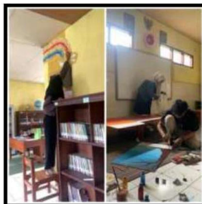
Dokumentasi Kegiatan 10 Maret 2022