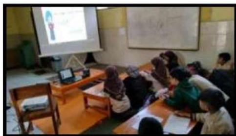
Dokumentasi Kegiatan 08 April 2022