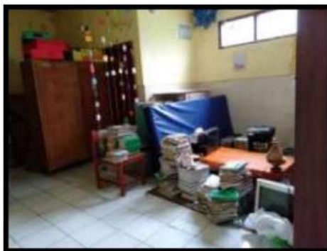
Dokumentasi Kegiatan 08 Maret 2022