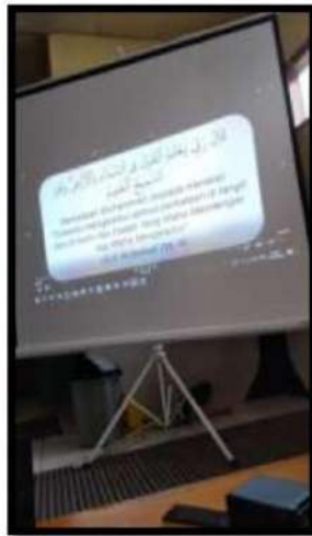
Dokumentasi Kegiatan 06 April 2022