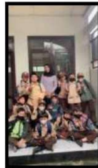
Dokumentasi Kegiatan 23 April 2022