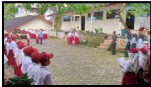
Dokumentasi Kegiatan 13 Mei 2022