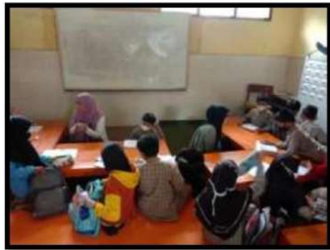
Dokumentasi Kegiatan 17 Maret 2022