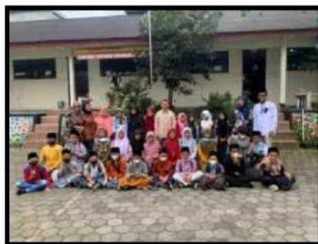
Dokumentasi Kegiatan 14 2022