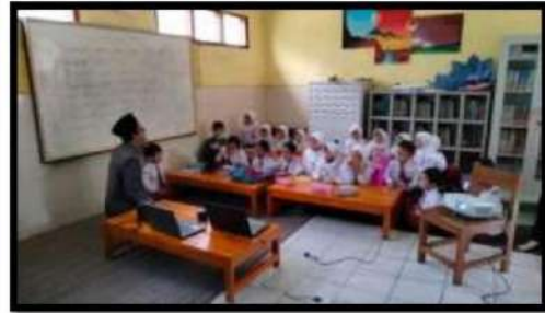
Dokumentasi Kegiatan 05 April 2022