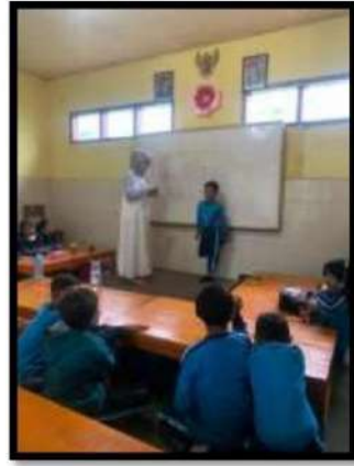
Dokumentasi Kegiatan 15 Maret 2022