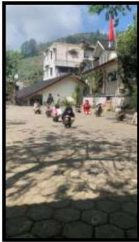
Dokumentasi Kegiatan 30 Maret 2022