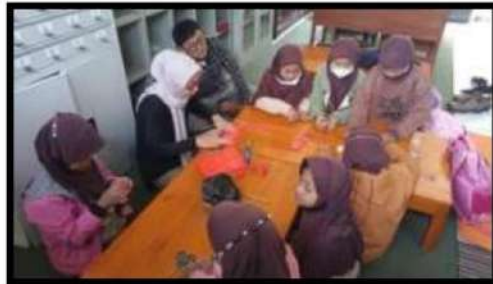
Dokumentasi Kegiatan 19 Maret 2022