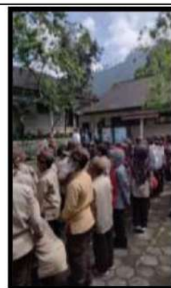
Dokumentasi Kegiatan 16 April 2022