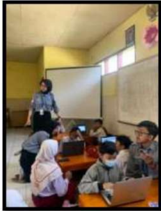
Dokumentasi Kegiatan 28 Maret 2022