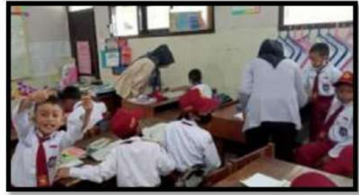
Dokumentasi Kegiatan 10 Mei 2022