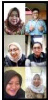
Dokumentasi Kegiatan 22 April 2022