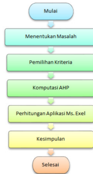
Gambar 2. Tahap-tahap penelitian

Kriteria-kriteria pada Tabel 2 dimasukkan ke dalam tabel perbandingan dua kriteria berpasangan seperti terlihat pada tabel 3.