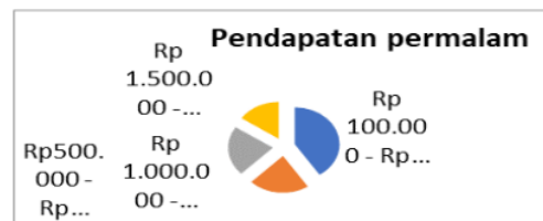
Gambar 3. Distribusi Frekuensi Variabel Pendapatan Per Malam

Analisis diskriptif merupakan analisis data guna bagaimana mendiskripsikan atau memberikan gambaran secara umum terkait data yang di peroleh atau terkumpul atas dasar hasil penelitian seperti memberikan sebuah gambaran kondisi responden yang dapat memberikan sebuah informasi tambahan dengan tujuan memahami penelitian tersebut. Dengan mengambarkan berbagai profil dari data yang di peroleh, di olah. Penelitian tersebut saling berhubungan antara variabel satu dengan variabel lainnya .