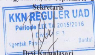
Desi Kumalasari NIM12017018