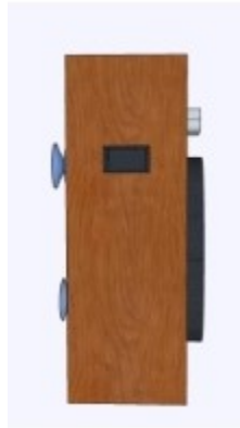
Tampak Samping Kiri