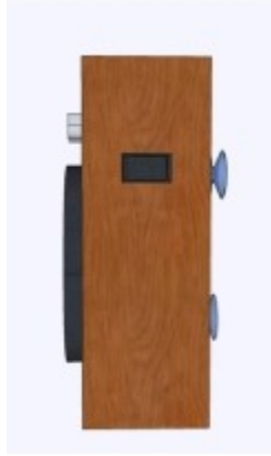
Tampak Samping Kanan