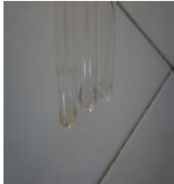
Gambar 2. Hasil skrining senyawa metabolit steroid sampel jantung pisang batu