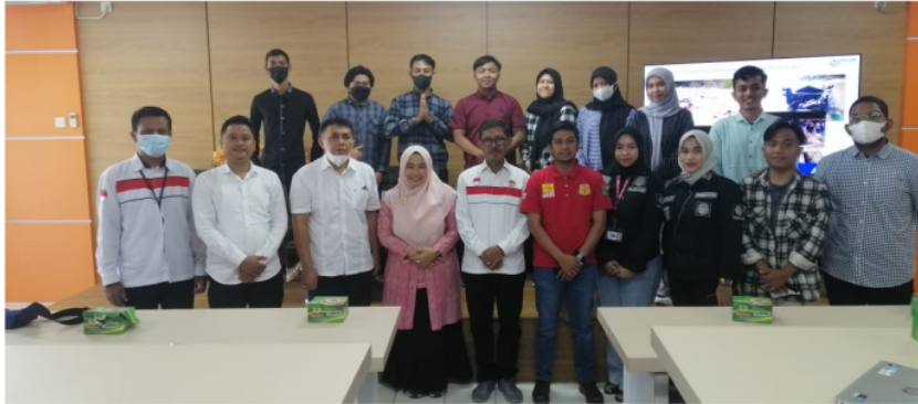
Gambar 7. Foto Bersama Narasumber dan Peserta