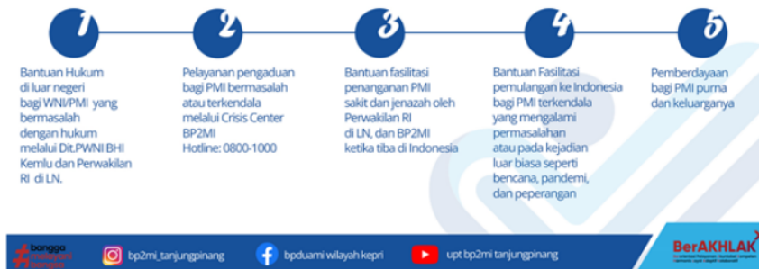
Gambar 6. Bentuk Perlindungan Hukum

Jawaban : Bentuk Pelindungan Pemerintah Tidak Spesifik Bagi PMI Passing saja, melainkan holistik bagi PMI bermasalah atau terkendala