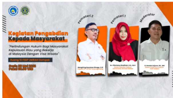
Gambar 1. Flyer Kegiatan

Kegiatan pengabdian ini dihadiri peserta dari Dinas Tenaga Kerja Provinsi Kepulauan Riau, Dinas Tenaga Kerja Kota Tanjungpinang, Kantor Imigrasi Kota Tanjungpinang, serta peserta dari Mahasiswa Fakultas Ilmu Sosial dan Ilmu Politik Universitas Maritim Raja Ali Haji.