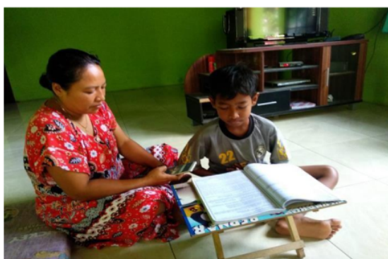
Gambar 1. Foto pembelajaran dari rumah peserta didik SDN Rejosari 3 melalui daring (dalam jaringan).

Karakter sosial adalah keseluruhan perilaku individu dengan kecenderungan tertentu dalam berinteraksi dengan serangkaian situasi. Hal tersebut menyatakan bahwa setiap orang mempunyai cara berperilaku yang khas seperti sikap, bakat, adat, kecakapan, kebiasaan, dan tindakan yang sama setiap hari (Wardati, 2019: 264). Lebih lanjut secara sosiologis Wardati menerangkan bahwa karakter terbentuk melalui proses sosialisasi yang dimulai sejak seseorang dilahirkan sampai menjelang akhir hayatnya sehingga melalui proses sosialisasi seseorang individu mendapatkan pembentukan sikap dan perilaku yang sesuai dengan perilaku kelompoknya. Dari penjelasan tersebut dapat diberi kesimpulan bahwa manusia pada dasarnya adalah makhluk sosial, sebagai makhluk sosial sudah barang tentu interaksi dan sinergi satu sama lain menjadi kebutuhan mendasar. Agar interaksi dan sinergi tetap terpelihara maka perlu penanaman karakter sosial terkhusus dalam hal ini adalah peserta didik. Berikut ini adalah foto sekaligus skema internalisasi nilai literasi dan karakter sosial/gotong royong dalam pembelajaran PAI dalam jaringan (daring) di SDN Rejosari 3: