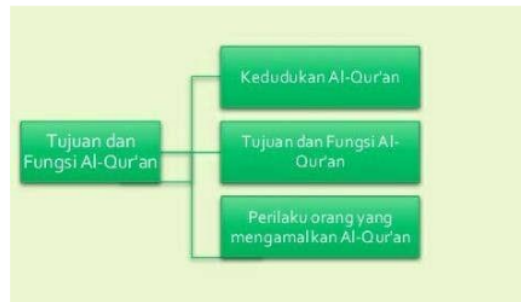
Gambar 1: Peta konsep materi pembelajaran Alquran SMP [21].