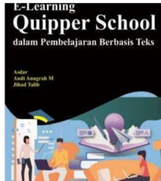
Gambar 3 : E-larning Quipper School berbasis teks [29]

Gambar diatas merupakan salah satu pengembangan materi Quipper School berbasis teks sesuai relevan penelitian materi dikembangkan dilaksanakan melalui lima tahapan, yaitu analisis, desain, produksi, uji coba, dan distribusi. Tahap analisis meliputi analisis tujuan pembuatan bentuk pembuatan produk. Tahap desain meliputi tata cara menginput materi teks pdf/powerpoint, materi berbentuk video pembelajaran, soal ujian, pekerjaan rumah (PR). Tahap produksi meliputi pemasukan semua bahan-bahan ada, sinkronisasi dan menguji coba jalannya program. Tahap uji coba terdiri dari uji kelayakan terbatas oleh pra ahli materi dan ahli media, dan uji lapangan meliputi: preliminary field testing, main field testing, dan operational field testing [30]. Tahap distribusi yaitu menyebarluaskan produk yang sudah direvisi ke pengguna. Data dikumpulkan menggunakan lembar observasi, kuesioner dan tes, dan dianalisis dengan statistic deskriptif. Hasil uji coba digunakan untuk memperbaiki materi pembelajaran berbasis quipper school hasil pengembangan [31].