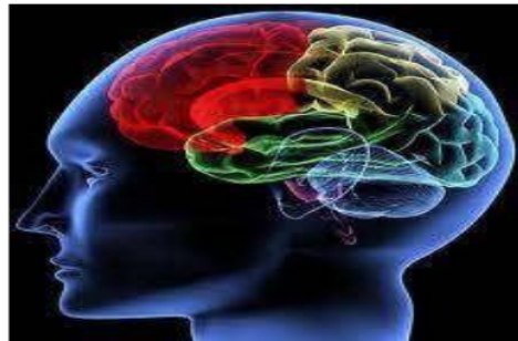
Gambar 4: Penerapan Teori Kerja Otak (Neurosains) dalam Pembelajaran [38]

Tentunya pembelajaran agama Islam dengan pendekatan otak diterapkan sejak SD atau MI kepada peserta didik, memberi dan mengarahkan kepada peserta didik dalam belajar dengan respon otaknya. Dendan daya emosional dan hati yang konsentrasi dan senang akan membuahkan hasil belajar yang maksimal. Hal tersebut akan menumbuhkan kecerdasan emosional bertumpu pada hubungan antara perasaan, watak, dan naluri moral. Banyak bukti menunjukkan bahwa sikap etik dasar dalam kehidupan berasal dari kemampuan emosional yang mendasarkannya [37]. Berikut gambar pembelajaran berbasis Neurosains :