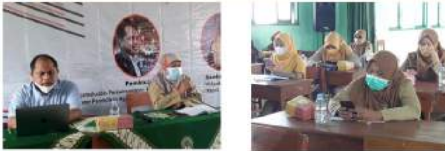
Gambar 1. Kepala Sekolah memberikan sambutan pembukaan kegiatan dan guru-guru mengerjakan lembar kerja pada Google Form

Pada pemaparan materi, pemateri memberikan penilaian pretest untuk mengetahui tingkat pemahaman dan keterampilan peserta terhadap struktur organisasi sekolah dan manajemen sumber daya manusia. Kegiatan pretest diberikan melalui Google Form yang diisi oleh peserta secara langsung sebelum pemateri menyampaikan materi-materi terkait tema PKM. Hasil dari kegiatan pretest menunjukkan hal-hal berikut: 1) Pemahaman peserta terhadap struktur organisasi 85,78 %; 2) Pembagian tugas 88,42 %; 3) Departementalisasi 81,57 %; 4) Rentang kendali 71,57 %; 5) Wewenang 71,05 %; 6) Spesifikasi pekerjaan 82,02 %; 7) Pemahaman terhadap manajemen sumber daya manusia 87,36 %; 8) Perencanaan 82,63 %; 9) Seleksi 89,47 %; 10) Pelatihan 71,57 %; 11) Pengembangan 80,52 %; 12) Penilaian kinerja 86,48 %; dan 13) Kompensasi 71,57 %.