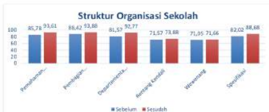
Gambar 2. Diagram Peningkatan Pengetahuan, Keterampilan, dan Layanan Struktur Organisasi Sekolah

Berdasarkan gambar 2. dapat difahami bahwa peningkatan pemahaman terhadap pentingnya struktur organisasi sekolah meningkat dari 85,78 % menjadi 93,61 %, pembagian tugas dalam struktur organisasi sekolah meningkat dari 88,42 % menjadi 93,88 %, departementalisasi dari 81,57 % meningkat menjadi 92,77 %, rentang kendali 71,57 % meningkat menjadi 73,88 %, wewenang dari 71,05 % meningkat menjadi 71,66 %, dan spesifikasi dari 82,02 % meningkat menjadi 88,68 %.