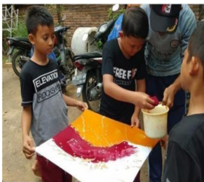
Gambar 5. Belajar batik di pengrajin batik

Kesepakatan sekolah dengan berbagai unit lingkungan sekolah direalisasikan dalam beberapa kegiatan. Kegiatan yang dilakukan antara lain pengolahan sampah sekolah dijadikan kompos dan eco enzim, tanaman empon-empon dijadikan jamu (ekstrakurikuler pembuatan jamu), kebun dan taman sekolah dijadikan sumber belajar IPA, sangkar burung dan kolam ikan sebagai sumber belajar IPA, belajar di luar kelas (pasar, bank, kantor kecamatan, puskesmas dll), belajar secara langsung ke pengusaha/pengrajin batik, dokter kecil, belajar menabung, pramuka, outbond, kunjungan ke kantor desa dan kantor kecamatan, bakti sosial, pembuatan pot dari barang bekas, studi di pabrik bakpia Tutut, penghijauan sekolah, dan sholat dhuha, ashar berjamaah di masjid. Secara umum, siswa senang dalam mengikuti kegiatan sekolah yang melibatkan unit di lingkungan sekolah ini. Hal ini dibuktikan dengan antusias siswa dalam mengikuti kegiatan (seperti terlihat pada gambar 5 dan gambar 6). Namun demikian, terdapat beberapa kendala yang dihadapi sekolah dalam menjalin kerja sama dengan mitra, yaitu pengkondisian ketertiban siswa saat melaksanakan kegiatan, transportasi dan keamanan siswa menuju lokasi mitra, dan keterbatasan sarana prasarana sekolah sebagai tindak lanjut belajar di unit usaha sekitar sekolah. Selama masa pandemi COVID-19 pemberdayaan lingkungan sekolah menjadi terbatas, bahkan beberapa kegiatan, seperti kunjungan ke tempat usaha, ke pasar, ke instansi pemerintah terdekat, tidak terlaksana.