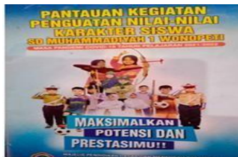
Gambar 2. Cover buku harian siswa