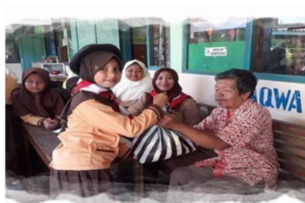
Bakti Sosial dalam rangka Peringatan Hari Pramuka ke 58