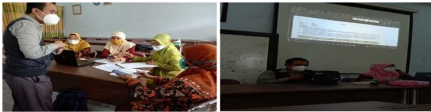
Gambar 2. Proses pendampingan penyusunan perangkat pembelajaran PPKn bermuatan pendidikan antikorupsi

Kegiatan ketiga dan keempat dalam tahapan pelaksanaan adalah finalisasi perangkat pembelajaran PPKn SMA dan SMK bermuatan pendidikan antikorupsi dan progres report penyusunan perangkat pembelajaran PPKn SMA dan SMK bermuatan pendidikan antikorupsi. Kegiatan finalisasi dilaksanakan pada 20 – 27 Agustus 2021 secara mandiri oleh tim masing-masing. Pelaksanaan progress report pada 28 Agustus 2021 melalui zoom meeting. Luaran kegiatan berupa 6 silabus mata pelajaran PPKn dan 8 Rencana Pelaksanaan Pembelajaran. Silabus tersebut terbagi menjadi 3 silabus mata pelajaran PPKn SMA dan 3 silabus mata pelajaran PPKn SMK. Sedangkan RPP meliputi RPP PPKn SMA Kelas X semester Gasal, RPP PPKn SMA Kelas X semester Genap, RPP PPKn SMA Kelas XI semester Gasal, PP PPKn SMA Kelas XI semester Genap, RPP PPKn SMK kelas XI semester Gasal, RPP PPKn SMK kelas XI semester Genap, dan RPP PPKn SMK kelas XII semester Gasal. Tabel 2 berikut merupakan rekapitulasi hasil penyusunan perangkat pembelajaran PPKn SMA dan SMK bermuatan pendidikan antikorupsi. Sedangkan tabel 3 merupakan salah satu contoh silabus Mata pelajaran PPKn bermuatan PAK