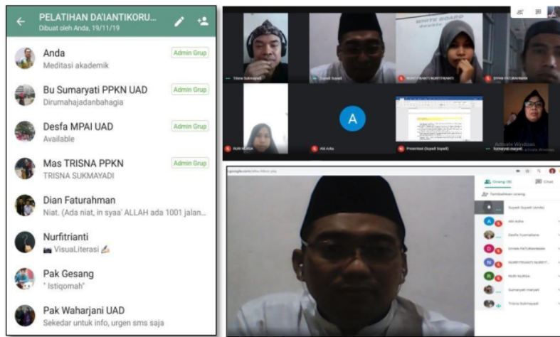
Gambar 4a. WhatsApp Group: Aplikasi Pendukung Pelatihan Da'i Antikorupsi

Setelah bimbingan teknis (bimtek), penyukuhan dan pendampingan yang telah dilakukan sejak 5 April dipandang cukup, maka implementasi pelatihan Da'i antikorupsi dilaksanakan pada hari Minggu 10 Mei 2020. Tim Pengabdian menjadi Host pada aplikasi Google Meet dengan kode: https://meet.google.com/ehu-hbcc-yiq , Host Phone: +1 347-815-1828 PIN: 105 568 877#. Kode ini dikirim ke WAG Pelatihan Da'i Antikorupsi dan peserta (Mubaligh-Mubalighah) diminta untuk gabung dalam Google Meet tersebut. Gambar 4a dan 4b berikut ini merupakan pelaksanaan pelatihan Da'i antikorupsi.