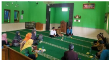
2b. Pelaksanaan sosialisasi pelatihan Da'i antikorupsi