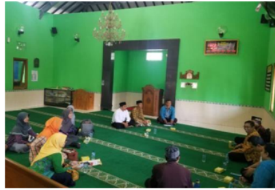
Gambar 1b. Analisis situasi bersama Ta' mir Masjid Prenggan

Gambar 1a merupakan analisis situasi awal bersama Lurah Prenggan yang telah menghasilkan kesepakatan untuk melibatkan Ta' mir Masjid, Da'i atau Mubaligh dalam pengembangan desa antikorupsi. Gambar 1b menunjukkan analisis situasi lanjutan bersama Perkumpulan Ta' mir Masjid se Kelurahan Prenggan untuk menyelenggarakan pelatihan Da'i antikorupsi. Analisis situasi ini menghasilkan kesepakatan bahwa pelatihan da'i antikorupsi bagi Mubaligh-Mubalighah terdampak Physical Distancing akibat pandemi Covid-19 dilaksanakan secara daring, menggunakan aplikasi utama "Google Meet" dan aplikasi pendukung "WhatsApp Group."