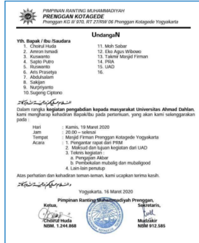
Gambar 2a. Undangan Sosialisasi Pelatihan Da'i antikorupsi oleh Mitra