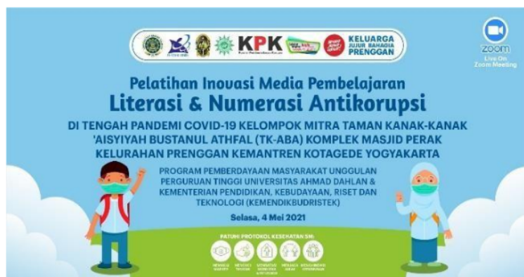
Gambar 3. Background Kegiatan PPM

Pada sesi opening ceremony , Tim pengabdian membuka kegiatan dengan upacara sakral, yakni pembacaan ayat-ayat Al-Qur'an tentang antikorupsi (QS. Al-Maidah [5]: 62-63), dilanjutkan dengan menyanyikan lagu wajib Indonesia Raya dan Sang Surya, kemudian sambutan oleh pihak LPPM UAD (diwakili ketua Tim Pengabdian), dilanjutkan dengan Sambutan Kepala TK ABA Komplek Masjid Perak Prenggan, dan terakhir adalah sambutan Pemilik TK Kemantren Kotagede. Suasana opening ceremony ditunjukkan Gambar 4.