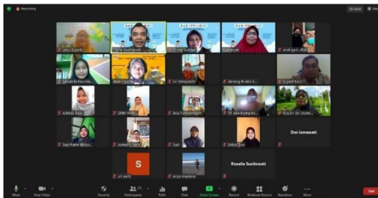
Gambar 8. Sesi foto closing ceremony

Gambar 7 merupakan salahsatu slide paparan inti pelatihan inovasi media pembelajaran literasi dan numerasi antikorupsi. Pada akhir acara, Tim Pengabdi memberi dua tugas kepada kelompok mitra (guru-guru TK ABA Komplek Masjid Perak), yakni membuat resume materi hasil pelatihan pada hari tersebut dan memasukkan inti cerita pada template yang telah disiapkan sebelumnya. Tugas pertama dikumpulkan pada Selasa, 11 Mei dan tugas kedua dikumpulkan pada 25 Mei 2021. Pada hari tersebut, Tim Pengabdi akan melakukan pendampingan guna menyempurnakan tugas penulisan buku cerita anak sebagai inovasi media pembelajaran literasi dan numerasi antikorupsi. Pada akhir acara, Tim Pengabdi dan seluruh peserta, yakni guru-guru TKABA Komplek Masjid Perak melakukan sesi foto bersama sebagaimana ditunjukkan Gambar 8.