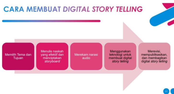
Gambar 6. Cara membuat digital storytelling

Gambar 5 menjelaskan cakupan inovasi media pembelajaran literasi dan numerasi yang terintegrasi dalam digital storytelling yang mencakup point of view , dramatic question , emotional content , the gift of your voice (narasi teks), soundtrack (suara dan musik), gambar, dan pacing atau irama cerita. Dengan demikian, buku cerita yang dikehendaki adalah buku cerita yang dapat disampaikan dengan berbagai media, termasuk media digital. Sedangkan Gambar 6 menjelaskan cara membuat digital storytelling yang meliputi: memilih tema dan tujuan, menulis naskah yang efektif dan menciptakan storyboard, merekam narasi audio, menggunakan teknologi untuk membuat digital storytelling , dan merevisi, digital storytelling .