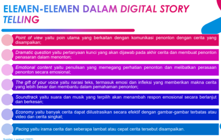
Gambar 5. Materi inovasi media pembelajaran literasi dan numerasi: elemen-elemen digital storytelling