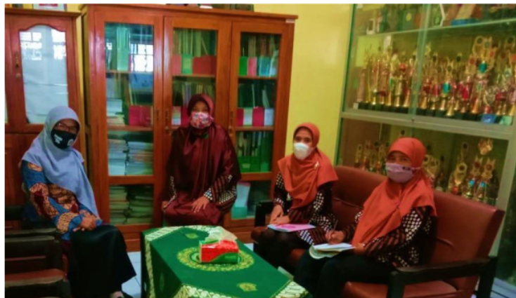
Gambar 2. Analisis situasi antara Tim Pengabdian dengan Kepala Sekolah dan para Guru TK ABA Komplek Masjid Perak Prenggan

Perwakilan Tim Pengabdian melakukan analisis situasi kepada kelompok mitra secara luring pada situasi melalui wawancara baik luring maupun daring. Permasalahan mitra selama pandemi COVID-19 cukup banyak, seperti menurunnya Pendaftaran Siswa Baru, krisis keuangan sekolah karena banyak siswa yang cuti, kendala pembelajaran daring, dan lain sebagainya. Namun Tim Pengabdian memandang bahwa semua permasalahan tersebut adalah problematika umum di semua lembaga pendidikan, terlebih lagi Taman Kanak-kanak. Oleh karena itu, kami ingin 24 analisis permasalahan yang lebih krusial, aktual dan memiliki potensi untuk mengatasinya, yakni pendidikan antikorupsi di masa Pandemi COVID-19. Pada tahun 2019, kelompok mitra telah mengembangkan pojok baca literasi antikorupsi, sehingga memungkinkan untuk dikembangkan. Gambar 2 menunjukkan analisis situasi yang dilakukan oleh perwakilan Tim Pengabdian dengan kelompok mitra Kepala Sekolah dan para Guru di TK ABA Komplek Masjid Perak.