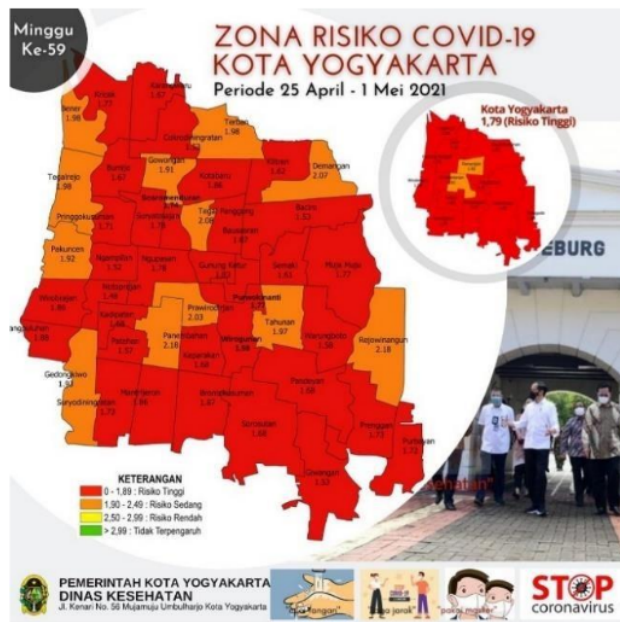
Gambar 1. Lokasi Pengabdian Masyarakat, Kelurahan Prenggan Zona Merah update 25 April sampai dengan 1 Mei 2021

Perwakilan Tim Pengabdian melakukan analisis situasi kepada kelompok mitra secara luring pada situasi melalui wawancara baik luring maupun daring. Permasalahan mitra selama pandemi COVID-19 cukup banyak, seperti menurunnya Pendaftaran Siswa Baru, krisis keuangan sekolah karena banyak siswa yang cuti, kendala pembelajaran daring, dan lain sebagainya. Namun Tim Pengabdian memandang bahwa semua permasalahan tersebut adalah problematika umum di semua lembaga pendidikan, terlebih lagi Taman Kanak-kanak. Oleh karena itu, kami ingin 24 analisis permasalahan yang lebih krusial, aktual dan memiliki potensi untuk mengatasinya, yakni pendidikan antikorupsi di masa Pandemi COVID-19. Pada tahun 2019, kelompok mitra telah mengembangkan pojok baca literasi antikorupsi, sehingga memungkinkan untuk dikembangkan. Gambar 2 menunjukkan analisis situasi yang dilakukan oleh perwakilan Tim Pengabdian dengan kelompok mitra Kepala Sekolah dan para Guru di TK ABA Komplek Masjid Perak.