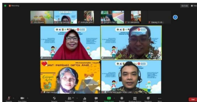
Gambar 4. Opening ceremony

Pada sesi opening ceremony , Tim pengabdian membuka kegiatan dengan upacara sakral, yakni pembacaan ayat-ayat Al-Qur'an tentang antikorupsi (QS. Al-Maidah [5]: 62-63), dilanjutkan dengan menyanyikan lagu wajib Indonesia Raya dan Sang Surya, kemudian sambutan oleh pihak LPPM UAD (diwakili ketua Tim Pengabdian), dilanjutkan dengan Sambutan Kepala TK ABA Komplek Masjid Perak Prenggan, dan terakhir adalah sambutan Pemilik TK Kemantren Kotagede. Suasana opening ceremony ditunjukkan Gambar 4.