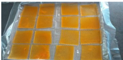
Gambar 2. Perubahan Fisik Selai Lembaran Jeruk Kalamansi

Perubahan fisik yang terjadi pada selai lembaran jeruk kalamansi dapat diketahui dengan pengamatan visual terhadap perubahan bentuk, warna, ukuran, tekstur dan berat selai lembaran jeruk kalamansi. Perubahan tersebut terjadi karena pengaruh dari proses pembuatan dan bahan baku yang digunakan. Perubahan bentuk, berat, dan ukuran pada selai lembaran jeruk kalamansi dipengaruhi oleh penyusutan pada saat pengolahan atau pemasakan dan pengeringan. Perubahan warna selai lembaran kurang terlihat karena didukung oleh pigmen warna jingga atau orange dari pepaya. Setelah kering tekstur selai lembaran berubah dan awalnya lembab, namun setelah kering selai menjadi kenyal, tidak mudah robek, dan muncul kristal gula, sehingga permukaannya sedikit lengket dan keluar butiran kristal kecil.