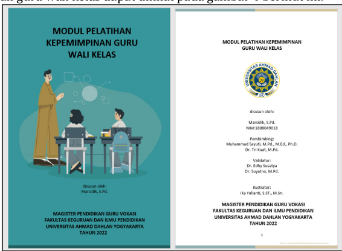
Gambar 4. Tampilan Modul Pelatihan Kepemimpinan Guru wali Kelas

Modul empat tentang bimbingan karier. Materi bimbingan karier dimasukkan dalam modul kepemimpinan guru wali kelas karena merupakan bagian dari rangkaian pembinaan kepada siswa. Siswa lulusan sekolah menengah pertama kemudian masuk di sekolah kejuruan atau SMK belum semua siswa memiliki tujuan kariernya, sehingga banyak dari siswa SMK yang motivasi belajarnya rendah. Dengan kemampuan guru wali kelas untuk dapat mengarahkan siswa memahami tentang karier dan mampu menentukan pilihan kariernya maka masalah kebingungan siswa akan kariernya ke depan dapat diatasi. Hartono (2018), mendefinisikan bimbingan karier adalah proses membantu siswa/konseli dalam hal memahami dirinya, lingkunganya terutama lingkungan dunia kerja, menentukan pilihan kerja, dan akhirnya membantunya menyusun rencana untuk mewujudkan keputusan yang diambil terkait dengan kariernya. Muhali (2019) mendeskripsikan kecakapan hidup dan berkarier memiliki komponen fleksibilitas dan adaptabilitas, memiliki inisiatif dan dapat mengatur diri sendiri, interaksi sosial dan antar budaya, produktivitas dan akuntabilitas mengelola proyek dan menghasilkan produk, dan kepemimpinan dan tanggung jawab. Tampilan cover modul pelatihan kepemimpinan guru wali kelas dapat dilihat pada gambar 4 berikut ini.