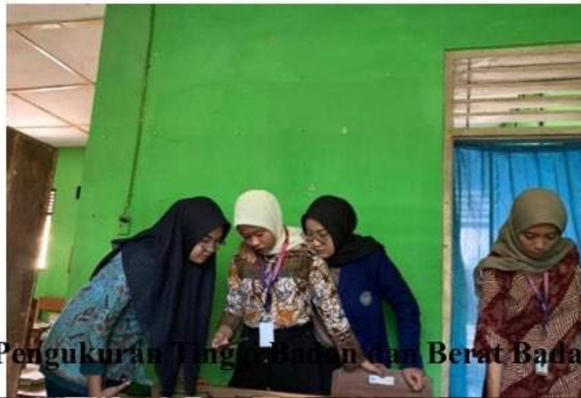
Pengukuran Tinggi Badan dan Berat Badan