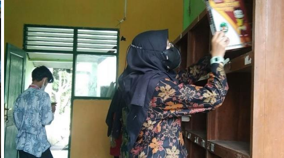
i. Kegiatan Program Kerja (Apotek Hidup, Mading, Pengecatan Perpustakaan, Pengecatan Pagar sekolah, Membatik)