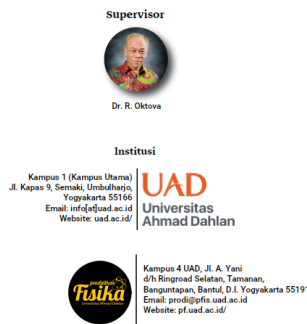
Gambar 3. Tampilan bagian penutup video pembelajaran.

Tampilan selanjutnya dalam video pembelajaran adalah bagian penutup yang terdiri atas ucapan terimakasih dan deksripsi produk seperti tertampil pada Gambar 3.