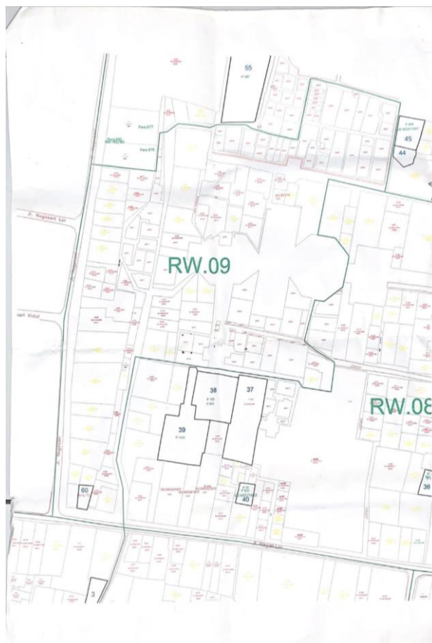
Gambar 1. Denah Wilayah RW 09, Patehan.

Kuliah Kerja Nyata (KKN) Alternatif periode 84 unit IV.C.3 bertempat di RW 09 Kelurahan Patehan, Kemantren Kraton, Kota Yogyakarta. RW 09 Kelurahan Patehan ini memiliki 5 Rukun Tetangga (RT) yang terdiri dari RT 34, 35, 36, 37, dan 38. Berikut merupakan denah dari lokasi KKN Alternatif 84 unit IV.C.3 :