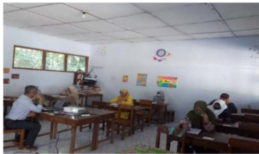
Gambar 3. Materi tentang Penguatan SDM Dari Perspektif Ekonomi Menghadapi Masa Pandemi Covid-19