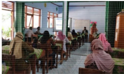
Gambar 2. Materi tentang Penguatan SDM Dari Perspektif Psikologis Menghadapi Masa Pandemi Covid-19