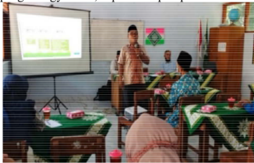
Gambar 1. Materi tentang Penguatan SDM Dari Perspektif PAI Menghadapi Masa Pandemi Covid-19

masyarakat (PKM) ini dibuka oleh pimpinan ranting Muhammadiyah Samigaluh Kabupaten Kulonprogo Yogyakarta, seperti tampak pada Gambar 1, 2, dan 3.