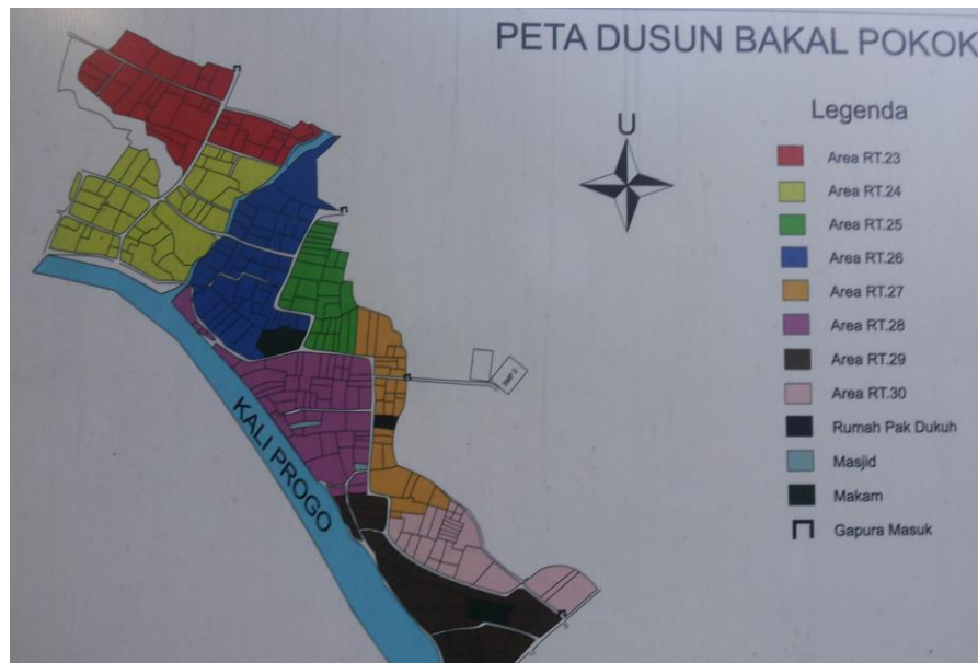
Gambar 1. Peta wilayah Dusun Bakal

Dusun bakal merupakan dusun yang cukup luas dengan data kependudukan sejumlah 291 kepala keluarga. Data ini didapatkan di kantor pemerintahan desa setempat dengan keterangan tahun 2015. Sarana dan prasarana yang ada meliputi 2 masjid dan 1 mushola. Dusun Bakal memiliki penduduk yang mayoritas beragama Islam, setelah itu beragama Kristen dan Katolik. Kerukunan beragama di dusun ini terbina dengan baik. Budaya yang ada dalam masyarakat masih terjaga dengan baik. Tradisi -tradisi seperti syukuran, tahlilan, dan berbagai upacara adat jawa masih dilestarikan. Sebagian besar Penduduk di Dusun Bakal bermata pencaharian sebagai petani, dan buruh. Hampir semua penduduk di dusun ini memiliki lahan pertanian, walaupun pekerjaan utama mereka bukanlah petani. Selain di sektor pertanian, penduduk di dusun ini memiliki usaha sampingan di sektor pertanian dan kerajinan dari mendong. Dusun setempat juga memiliki wadah untuk meningkatkan hasil sektor pertanian dan peternakan dengan membentuk Kelompok Wanita Tani (KWT) “Mekar Jannah”. Kelompok yang dibuat bertujuan untuk mewadahi aspirasi, meningkatkan pengetahuan dan meningkatkan ekonomi warga dari sektor pertanian dan peternakan.