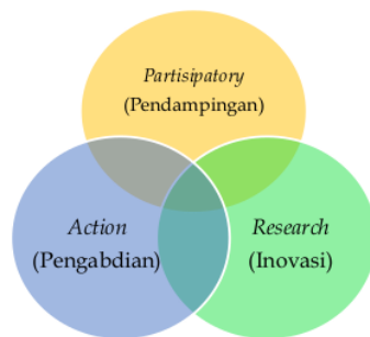
Gambar 2. Konsep Participatory Action Research (PAR)

Metode pelaksanaan pengabdian masyarakat ini menggunakan Participatory Action Research (PAR) (Kindon, Pain, 2007; Whyte, 1991). Dipilihnya pendekatan PAR karena memiliki kekuatan untuk menyatukan peneliti dan masyarakat (Baum, 2016). Disamping itu, PAR juga dapat dimanfaatkan untuk mengedukasi masyarakat menuju perubahan yang direncanakan (Morales, 2016). Dalam hal ini, tim peneliti dan pengabdian menyatu dengan Paguyuban Mubalig Prenggan untuk melakukan analisis situasi, perencanaan program kegiatan hingga aksi menuju perubahan. Dengan demikian, PAR mengintegrasikan antara partisipasi masyarakat, peneliti, dan aksi pengembangan potensi mitra. Gambar 2. menunjukkan integrasi ketiganya.