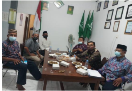
Gambar 3. Analisis situasi bersama mitra Paguyuban Mubalig Prenggan