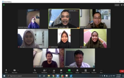
Gambar 2. Sosialisasi program pengabdian masyarakat kepada Lurah Prenggan

Meskipun demikian, pada tahap awal diperlukan updating analisis situasi terkini pada kelompok mitra Paguyuban Mubalig Prenggan melalui observasi dan sosialisasi kepada Perangkat Desa, khususnya Lurah Prenggan dan Pimpinan Ranting Muhammadiyah Prenggan. Kegiatan ini dilakukan sepanjang bulan April 2021 secara berkelanjutan baik secara daring maupun luring dan lisan maupun tertulis serta komunikasi lainnya terutama melalui Whatsapp . Media-media tersebut telah digunakan secara efektif selama masa pandemi Covid-19 dalam berbagai kepentingan, termasuk dakwah virtual (Dewi & Putra, 2020). Demikian pula dengan pengabdian masyarakat ini, proses sosialisasi dilakukan secara daring menggunakan aplikasi zoom meeting . Gambar 3. menunjukkan proses sosialisasi Tim Pengabdian kepada Lurah Prenggan secara virtual menggunakan zoom .