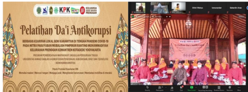
Gambar 7. Undangan dan pelaksanaan mengikuti pentas dakwah kultural antikorupsi berbasis kearifan lokal seni karawitan 2 Mei 2021