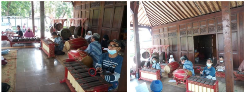
Gambar 6. Latihan karawitan Gending Dakwah Antikorupsi

“Gending Dakwah Antikorupsi” sebagaimana ditunjukkan Gambar 6. merupakan rekayasa hasil kolaborasi tim pengabdian dengan kelompok mitra Paguyuban Mubalig Prenggan. Gending inilah yang menjadi bahan latihan dakwah kultural Paguyuban Mubalig Prenggan. Uji coba latihan dilakukan selama satu bulan setiap hari Minggu sepanjang bulan April 2021. Jika uji coba ini tidak terjadi kluster Covid-19 maka latihan akan dilanjutkan secara terus-menerus sepanjang tahun. Latihan gending dakwah dilaksanakan di Balai Ajengan Kelurahan Prenggan Kotagede Yogyakarta. Latihan dipandu langsung oleh ketua bidang karawitan, yakni Bapak Sukarjiono.