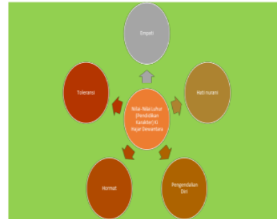
Gambar 1. Nilai-Nilai Luhur (Pendidikan Karakter) Ki Hajar Dewantara

Nilai-nilai luhur ajaran yang dibawa oleh Ki Hajar Dewantara tentu luas dan beragam. Oleh karena itu, dari 12 nilai luhur ajaran Ki Hajar Dewantara terdapat lima nilai pendidikan karakter yang penulis rangkum: empati, hati nurani, pengendalian diri, hormat, dan toleransi. Nilai karakter dijelaskan dalam tabel berikut: