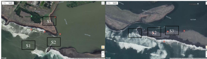
Gambar 1. Lokasi Titik Pengambilan Sampel. Muara sungai Progo (kiri) dan Muara sungai Opak (kanan)

Penelitian ini merupakan jenis penelitian eksploratif yang dilakukan pada Oktober 2019-Januari 2020 untuk mengetahui keanekaragaman meiofauna di muara Sungai Progo dan Opak (Gambar 1). Setiap muara sungai diambil tiga stasiun yang ditentukan dengan teknik purposive sampling dengan kriteria memiliki zona pasang-surut, tidak jauh dari mulut muara dan aman untuk diakses. Stasiun I merupakan stasiun yang paling dekat dengan laut, yaitu di mulut muara dengan jarak 100 meter dari laut. Jarak antara tiap stasiun adalah 200 meter. Setiap stasiun ditentukan tiga titik sampling dengan interval satu meter antar titik sampling (Gambar 2).