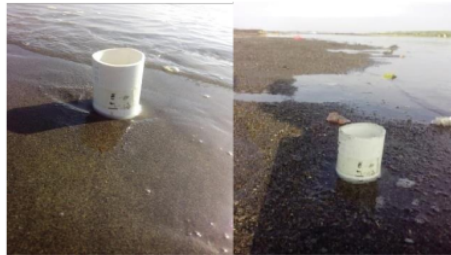
Gambar 4. Kondisi Subtrat di Kedua Muara Sungai. A. Sedimen di Stasiun Muara Sungai Progo (halus dan berlumpur); B. Sedimen di Stasiun 3 Muara Sungai Opak (kasar)

Stasiun 3 di muara Sungai Opak memiliki karakter sedimen yang berbeda dengan muara Sungai Progo. Berdasarkan pengamatan, sedimen pasir di stasiun 3 muara Sungai Opak terdiri dari bebatuan kecil dan sedikit pasir halus. Keadaan tersebut membuat pori-pori sedimen di muara Sungai Opak menjadi besar. Sebaliknya, sedimen pasir di stasiun 3 muara Sungai Progo terdiri dari campuran pasir dan lumpur yang akhirnya membuat pori-pori sedimennya menjadi kecil (Gambar 4). Karena kondisi tersebut, kemungkinan terdapat meiofauna tertentu yang banyak ditemukan di daerah tersebut.