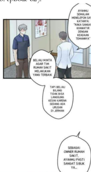
Gambar 2. Gambar Webtoon Sekotengs episode 82

(3) "Ayahmu semalam menelpon saya, katanya "Raka sangat khawatir dengan keadaan temannya". Beliau minta agar tim rumah sakit melakukan yang terbaik. Tapi beliau bilang tidak bisa langsung kesini karena sedang ada urusan di Jerman. Sebagai owner rumah sakit, ayahmu pasti sangat sibuk ya..." * dr. Ananda H., Sp. BTKV (K) (Lifina, 2018: episode 82).