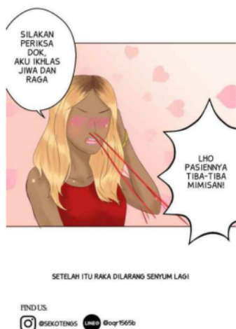
Gambar 3. Gambar Webtoon Sekotengs episode 17

Raka: “Lho pasiennya tiba-tiba mimisan!” (Lifina, 2018: episode 17).