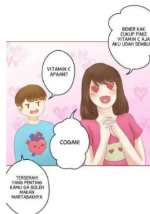
Gambar 4. Gambar Webtoon Sekotengs episode 24

Terra: “Bener kak cukup pake vitamin C aja aku udah sembuh. Cogani!” (Lifina, 2018: episode 24).