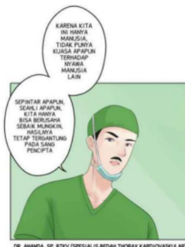
Gambar 1. Gambar Webtoon Sekotengs episode 33

Wujud masyarakat berketuhanan terlihat dari sosok dr. Ananda. Ia diceritakan sebagai dokter ahli bedah jantung. Kepintarannya dalam bidangnya sudah tidak diragukan lagi. Namun ia tetap berpendapat bahwa ia hanyalah manusia biasa. Segala sesuatu bergantung kepada sang pencipta, dokter hanya bisa berusaha sebaik mungkin. Anggapan seperti itu hanya terjadi ketika seseorang tunduk akan kuasa Tuhan. Seseorang yang tidak mengakui kekuasaan Tuhan pasti beranggapan bahwa kesembuhan berasal dari usaha dokter dan keberuntungan.