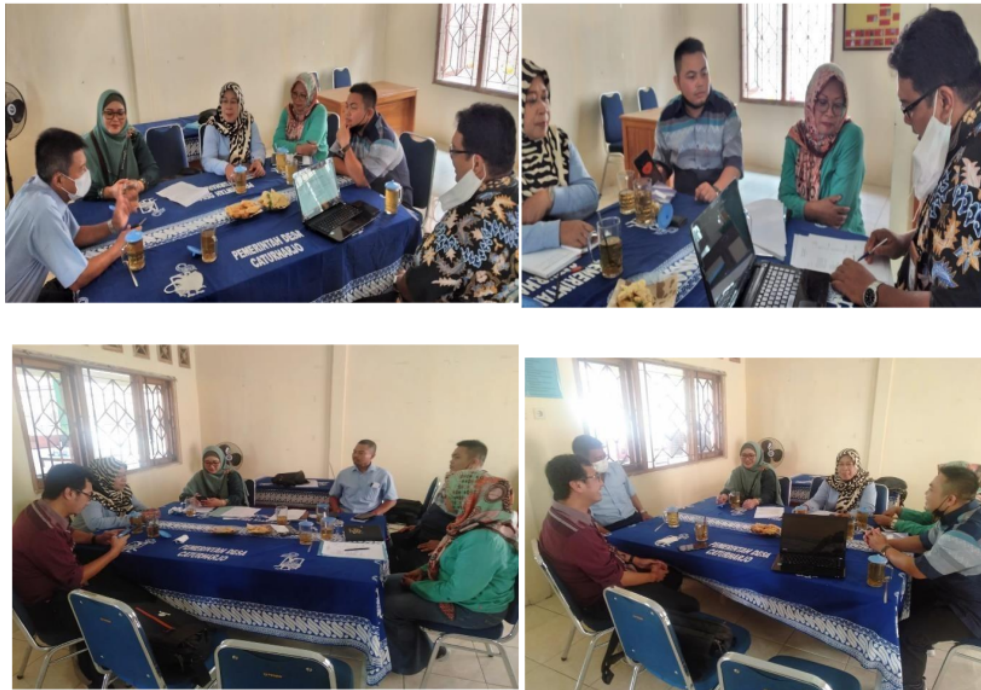
Gambar 2. Pelatihan Tata Kelola dan Laporan Keuangan Bumkal

Pelatihan ini diberikan kepada pengurus Bumkal Catur Sejahtera, Kalurahan Caturharjo, Bantul, Yogyakarta. Peserta pelatihan sangat antusias terhadap pelatihan ini karena dapat meningkatkan pengetahuan dan kinerja dalam mengelola bumkal. Metode pelatihan dengan menggunakan ceramah dan diskusi agar peserta tidak bosan dan jenuh. Pelatihan tata kelola dan laporan keuangan ini diselenggarakan pada hari Selasa, 2 Agustus 2022, pukul 09.00 – 14.00 WIB bertempat di Bumkal Catur Sejahtera.