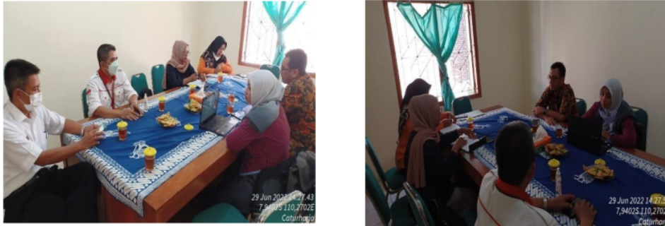
Gambar 3. Foto menunjukkan sosialisasi dan diskusi program PKM kpd DLH Kab Bantul, Lurah Kalurahan Caturharjo, Pengurus Bumkal

program pengabdian kepada masyarakat dan kolaborasi dengan kampus dalam hal pelatihan dan pendampingan Bumkal berbasis technopreneurship guna menuju ekonomi kreatif. Manfaat dari adanya pelatihan dan pendampingan ini dapat meningkatkan professionalism dan kemandirian pengelolaan bumkal.