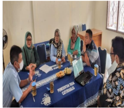
Gambar 6. Foto menunjukkan pelatihan dan pendampingan tata kelola bumkal dan laporan keuangan bumkal.