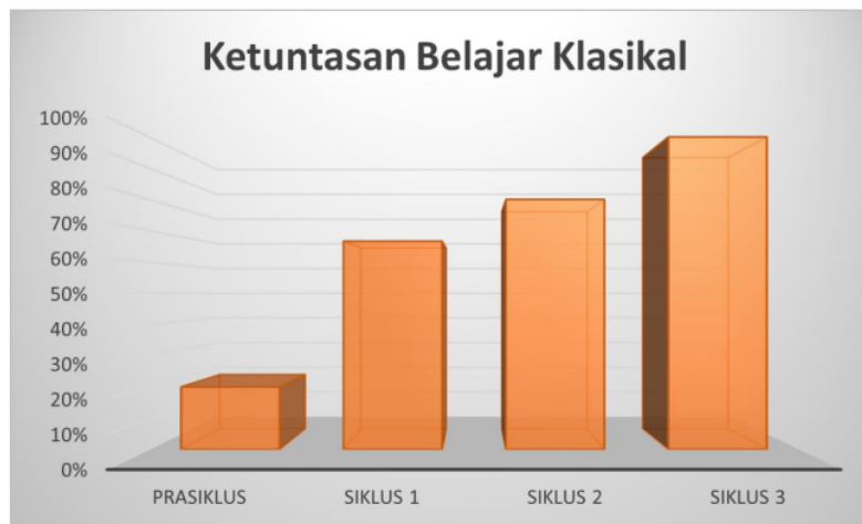
Gambar 2. Grafik hubungan ketuntasan belajar sebelum dilaksanakan perbaikan, siklus 1, siklus 2, dan siklus 3.