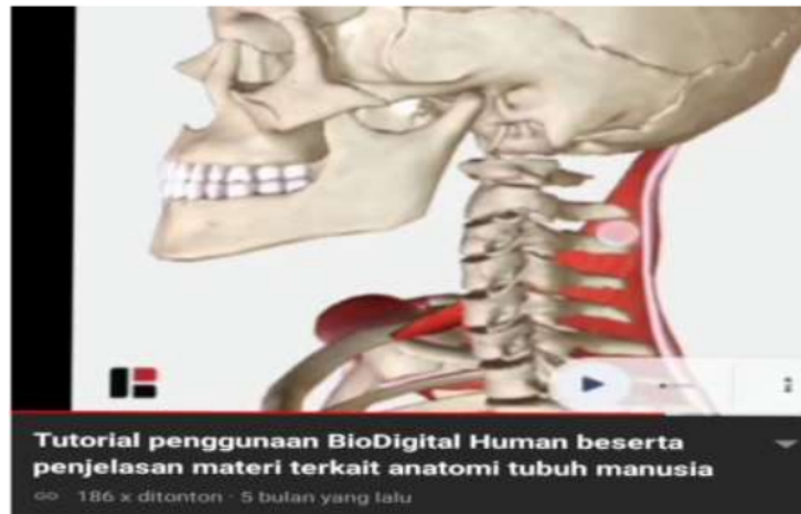
Gambar 1. Pengenalan tampilan BioDigital Human melalui video yang dibuat menggunakan rekam layar dan diunggah ke Youtube

BioDigital Human memiliki karakteristik sebagai media visual tiga dimensi dengan tampilan-tampilan gambar yang menarik dan dapat menghubungkan antara isi materi pelajaran dengan benda nyata atau keadaan nyata yang direpresentasikan melalui gambar. Hal ini sesuai dengan karakteristik media visual pembelajaran dapat menampilkan objek-objek, direpresentasikan melalui gambar yang menarik sehingga dapat mengembangkan dan menghubungkan materi pelajaran dengan menggabungkan semua unsur media menjadi satu kesatuan penyajian yang terintegrasi sehingga dapat membantu siswa memahami konsep suatu materi (Pranoto et al. , 2017).