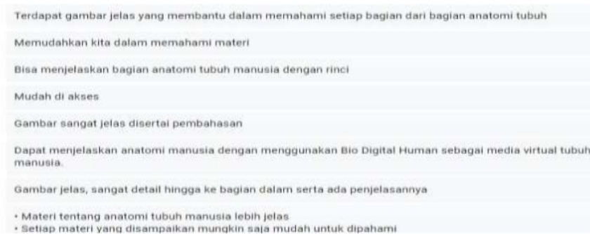
Gambar 3. Kelebihan BioDigital Human menurut persepsi siswa

BioDigital Human memiliki berbagai kelebihan dan kekurangan, siswa merasa BioDigital Human dapat membantu belajar karena mudah untuk diakses, visualisasi gambar jelas sehingga lebih mudah untuk memahami materi terkait anatomi tubuh manusia ( Gambar 3 ). Pranoto (2016) menyatakan media pembelajaran visual digital memiliki keunggulan pada gambar yang dapat merepresentasikan suatu objek nyata secara jelas dan detail.