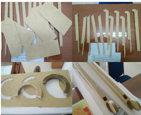
Gambar 3. Proses pembuatan prototype 1 Geoklik menggunakan karton

Pada tahap pengembangan ini dilakukan beberapa sub tahapan pengembangan yang pertama yaitu pengembangan Prototype 1 dan Geoklik v1. Pengembangan prototype 1 ini bertujuan merealisasikan desain tahap 2 Geoklik sehingga terlihat bentuknya dan untuk mencoba apakah alat bekerja dengan baik atau tidak. Prototype 1 ini dikembangkan dengan menggunakan bahan kertas karton setebal 3 milimeter dengan bantuan alat seperti cutter, gunting, lem kayu, lem cair, penggaris, pensil, busur, bor, amplas, dan masih banyak lainnya. Berikut ini proses dari pengembangan Geoklik prototype 1.