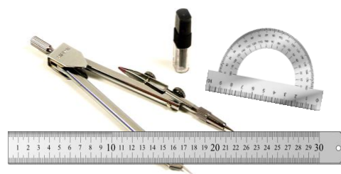
Gambar 1. Penggaris, jangka, dan busur

berfungsi untuk menggambar objek melingkar atau melengkung seperti lingkaran. Jenis-jenis jangka saat ini ada banyak sekali mulai dari model yang menggunakan pensil maupun yang tidak. Alat-alat ini sangatlah penting terutama bagi mereka yang berkecimpung dalam dunia menggambar misalnya seperti seorang arsitek ataupun guru. Dalam perkembangannya ketiga alat ini tidak terlalu mendapat banyak perhatian seiring berkembangnya teknologi. Akibatnya bentuk dan rupa nya tidak banyak mengalami perubahan yang berarti. Padahal teknologi yang semakin maju seharusnya pun ikut memberikan efek perkembangan pada alat-alat ini. Akibatnya, disaat alat-alat lain menjadi semakin praktis dan mudah digunakan seperti proyektor, smartboard,