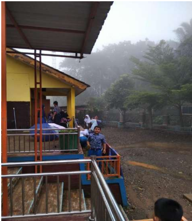
Pelaksanaan kebersihan lingkungan