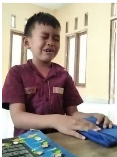
Hafalan doa sehari-hari