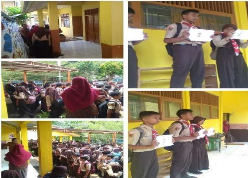
Membantu Adiministrasi Sekolah pada Pelaksanaan pemilihan ketua OSIS