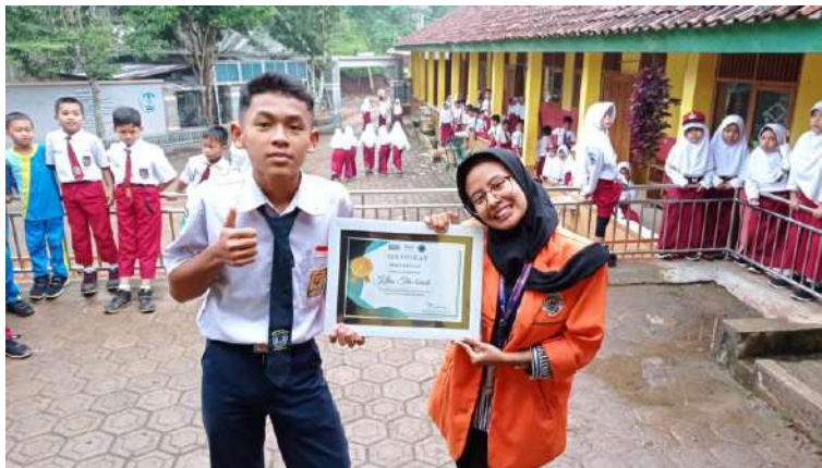
Lomba kebersihan dan lingkungan kelas