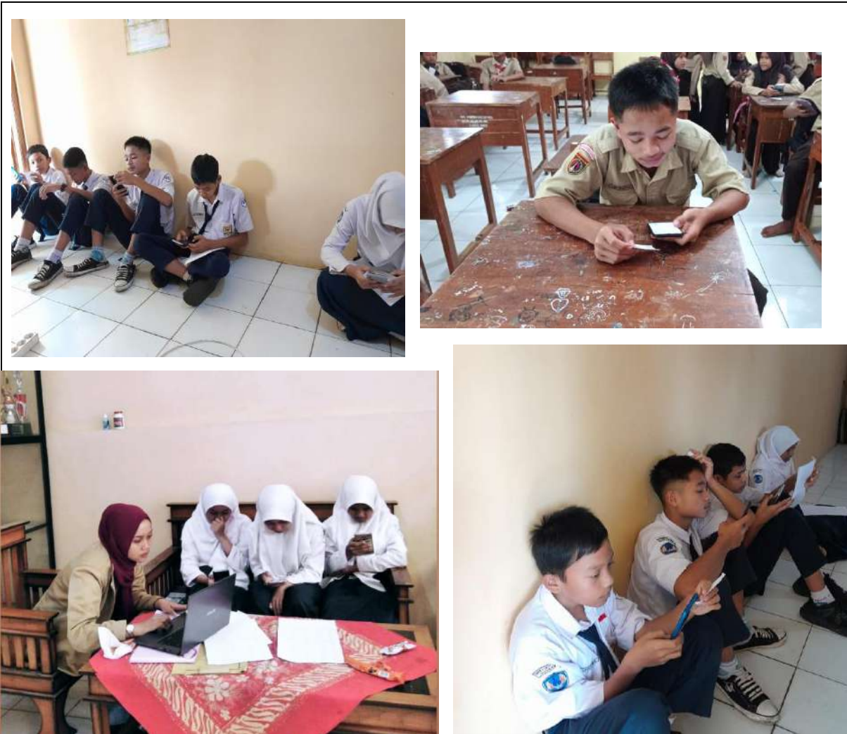
Pelaksanaan Pretest dan Postest bagi siswa kelas 8