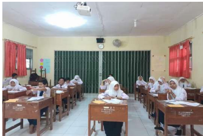
Pengajaran lagu-lagu nasional maupun daerah