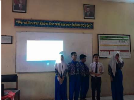
Adaptasi teknologi mengenai pembuatan Powerpoint yang sekaligus mempresentasikannya