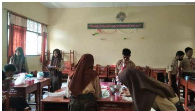
Praktek pembuatan sup buah