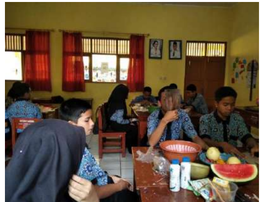
Praktek Pembuatan Salad buah