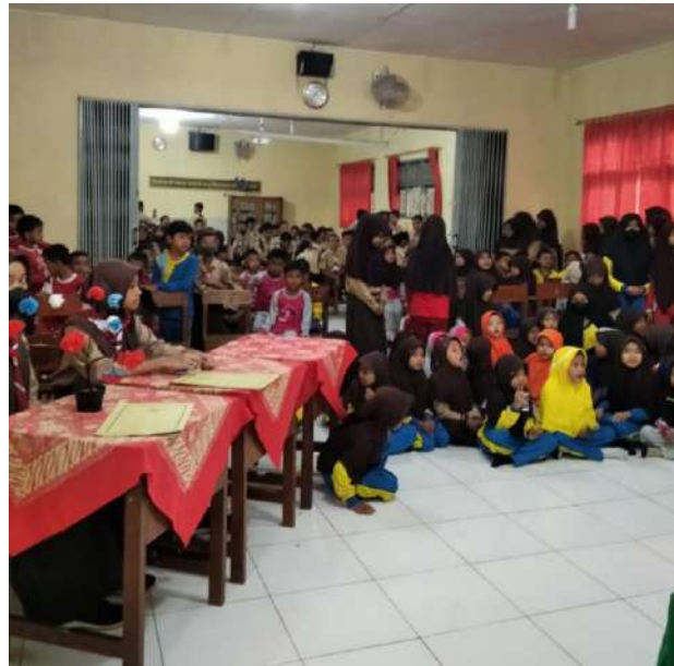
Membantu Administrasi sekolah pada perayaan hari besar