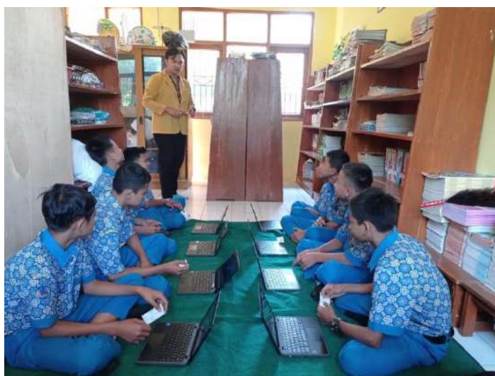
Pelaksanaan ANBK Sekolah