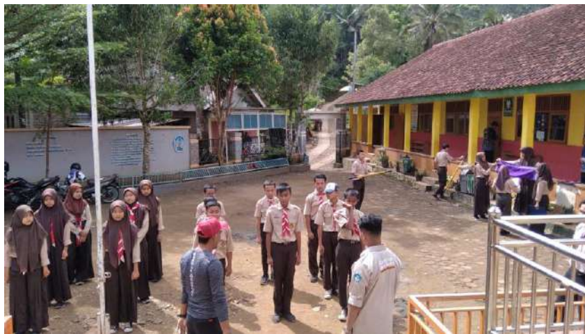
Pelaksanaan latihan upacara bendera