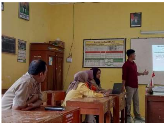
Sosialisasi aplikasi platform merdeka mengajar