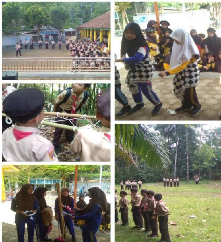
Membantu Administrasi sekolah pada pelaksanaan Perkemahan