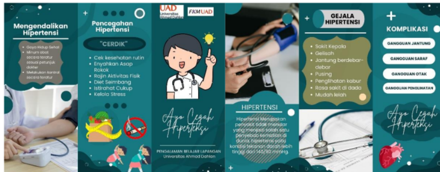
Gambar 3. Leaflet Intervensi Terkait Hipertensi

Penyuluhan dilakukan dengan menggunakan power point sebagai media yang paling tepat dalam melakukan edukasi secara offline. Sehingga masyarakat lebih aktif dan paham mengenai informasi yang disampaikan tentang hipertensi. Selain itu, penyuluhan hipertensi dengan membagikan media leaflet dalam kegiatan sebagai pendukung materi yang bisa dibaca jika ada yang belum dipahami. Penyuluhan ini adanya timbal balik dari sasaran terhadap materi yang diberikan seperti bertanya dan menceritakan pengalamannya terkait penyakit Hipertensi 1 . Ini juga didukung dengan penelitian yang membuktikan bahwa metode penyuluhan menggunakan power point dalam memberikan materi secara langsung kepada peserta dapat mendapatkan materi secara bersama-sama tentang hipertensi. Sebagai bahan bacaan peserta penyuluhan diberikan media leaflet yang dapat dibaca ulang apabila ada bagian yang belum dipahami 8 .