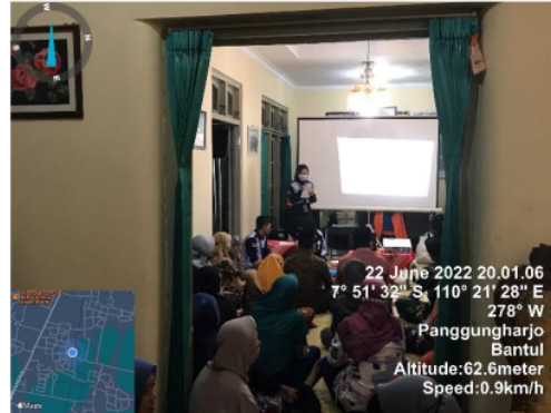
Gambar 1. Kegiatan intervensi Penyuluhan Hipertensi

Kegiatan penyuluhan berjalan secara baik dan lancar. Adapun sasaran dalam penyuluhan adalah masyarakat RT 04 Padukuhan Cabeyan terdiri atas bapak - bapak dan Ibu - ibu. Respon peserta terhadap edukasi penyakit hipertensi sangat baik ketika kegiatan berlangsung. Dalam pelaksanaan kegiatan intervensi, peserta penyuluhan memberikan respon yang positif, mereka terlihat sangat antusias dengan kegiatan penyuluhan ini karena kegiatan ini dapat menambah wawasan serta pengetahuan masyarakat khususnya terkait materi edukasi yang menekankan pencegahan serta pengendalian hipertensi.