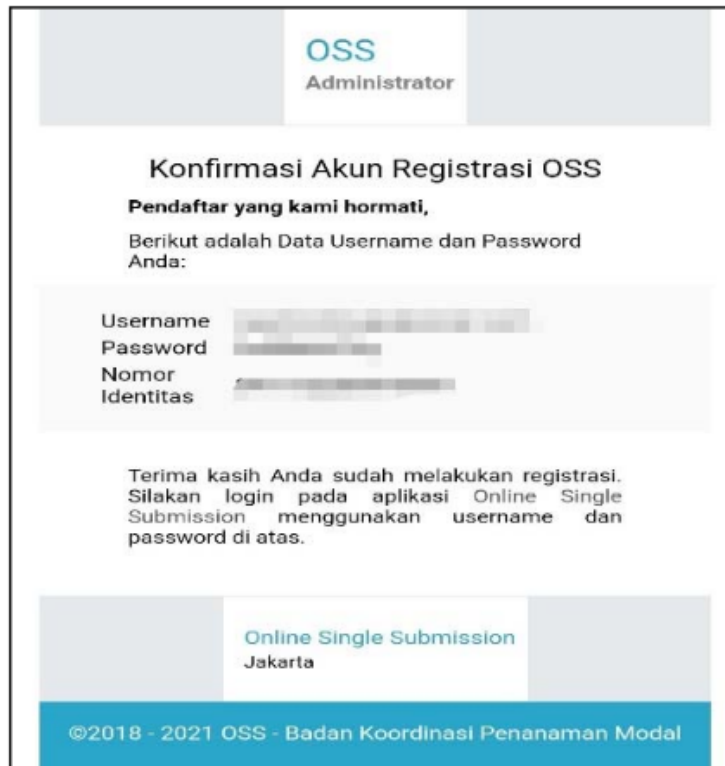
1 Gambar 5.