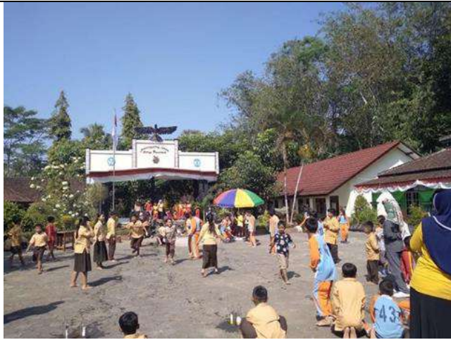
Pelaksanaan lomba dalam rangka memperingati HUT RI ke-77