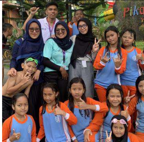
Rekreasi di Luar Kelas