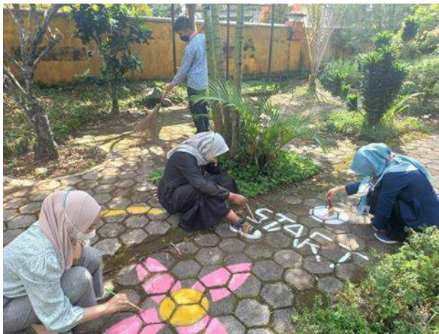
Pengadaan Taman Baca