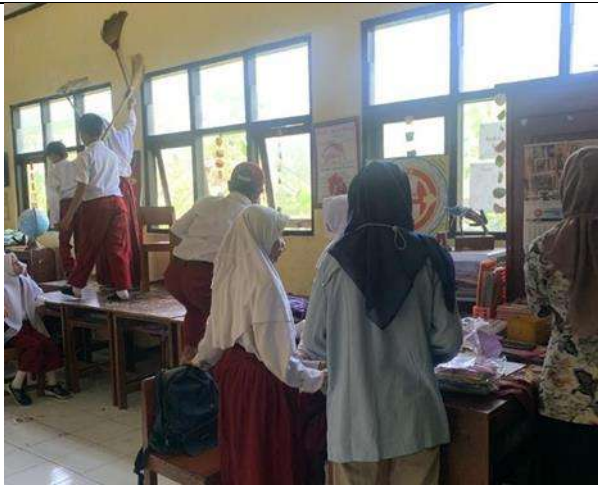
Peninjauan lomba kebersihan kelas.