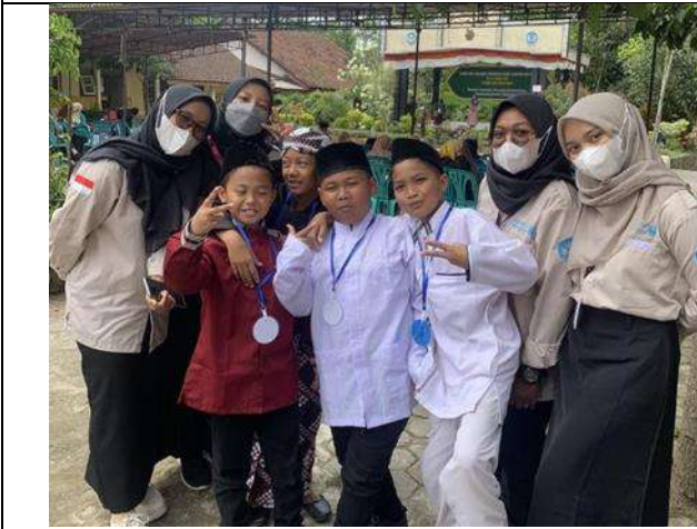
Pendampingan lomba MAMPSI tingkat Kecamatan