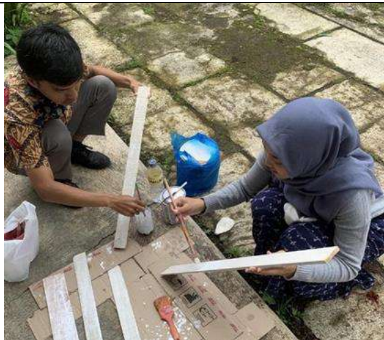
Pengadaan Apotek Hidup