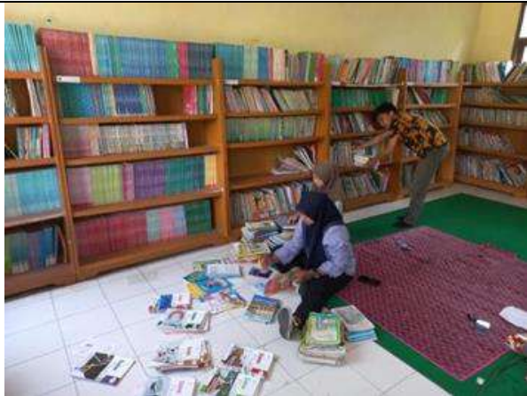
Penataan ulang buku dan lemari buku di perpustakaan