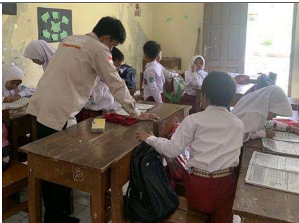
Pembelajaran di dalam kelas