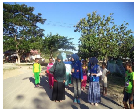
Pendampingan Gerak Jalan Karang Taruna