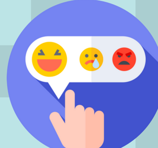
STRATEGI REGULASI EMOSI