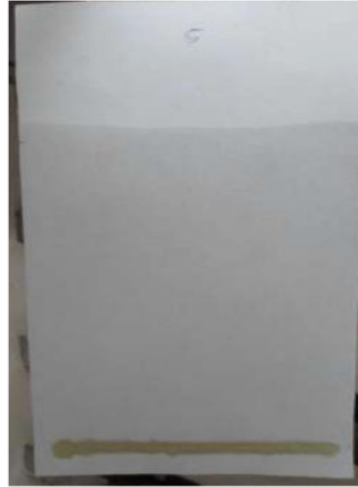
Gambar 1. Hasil elusi ekstrak etanol sambiloto menggunakan fase diam kertas Whatman dan fase gerak asam asetat 15%, sampel tidak dapat terelusi.

model pita pada fase diam kertas Whatman 1 dan dielusi dengan fase gerak asam asetat 15% tidak dapat terelusi seperti terlihat pada Gambar 1.