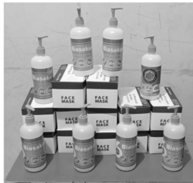
Gambar 7. Logistik sanitasi yang disiagakan untuk warga isolasi mandiri