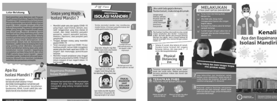
Gambar 4. Sosialisasi menggunakan media promosi kesehatan leaflet isolasi mandiri (Paten HAKI)