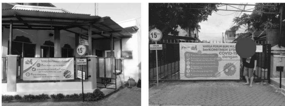
Gambar 2. Pemasangan banner media promosi kesehatan dan komitmen warga perumahan di pintu perumahan