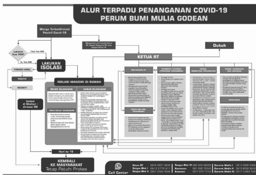
Gambar 5. Alur Terpadu Penanganan Covid-19 terkait isolasi mandiri