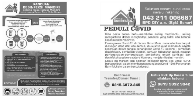
Gambar 6. Panduan Desinfeksi Mandiri dan sosialisasi penggalangan donasi