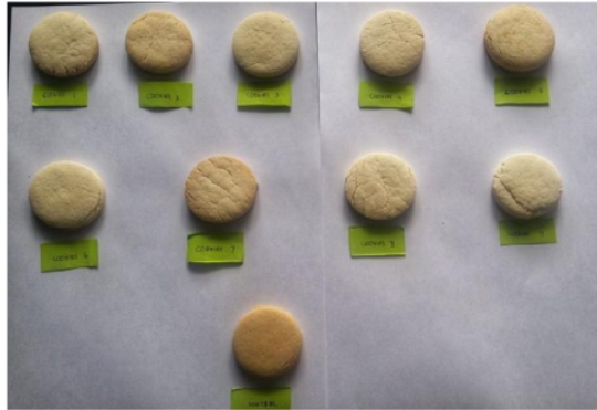
Gambar 1 Cookies Berbasis Tepung Beras, Tepung Tapioka dan Tepung Maizena