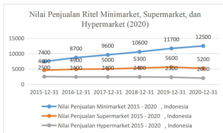
Gambar 2. Nilai Penjualan Retail Minimarket, Supermarket, dan Hypermarket (2020) Sumber: https://databoks.katadata.co.id , data diolah oleh penulis (2022)