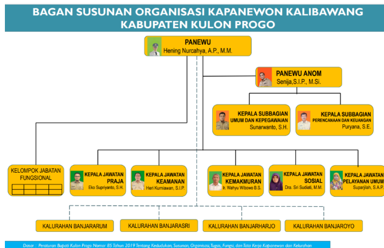
Gambar 1. Bagan Struktur Organisasi Kapanewon Kalibawang