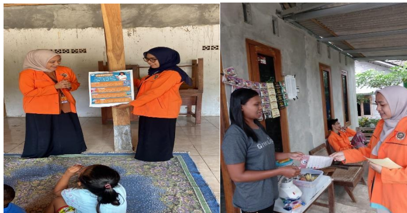
Gambar 1.5 Penyuluhan mengenai Dagusibu dan logo-logo obat

Penyelenggaraan Program Edukasi dan Penyuluhan Mengenai ( DAGUSIBU dan logo-logo obat) dilaksanakan di balai dusun Corot. Kegiatan ini mengajak masyarakat untuk mendapatkan, menggunakan, menyimpan dan membuang obat dengan baik dan benar. Selan itu, media ini juga digunakan untuk menambah pengetahuan masyarakat mengenai logo-logo obat.