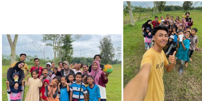
Gambar 4.8 Penyelenggaran kesenian dan keolahragaan