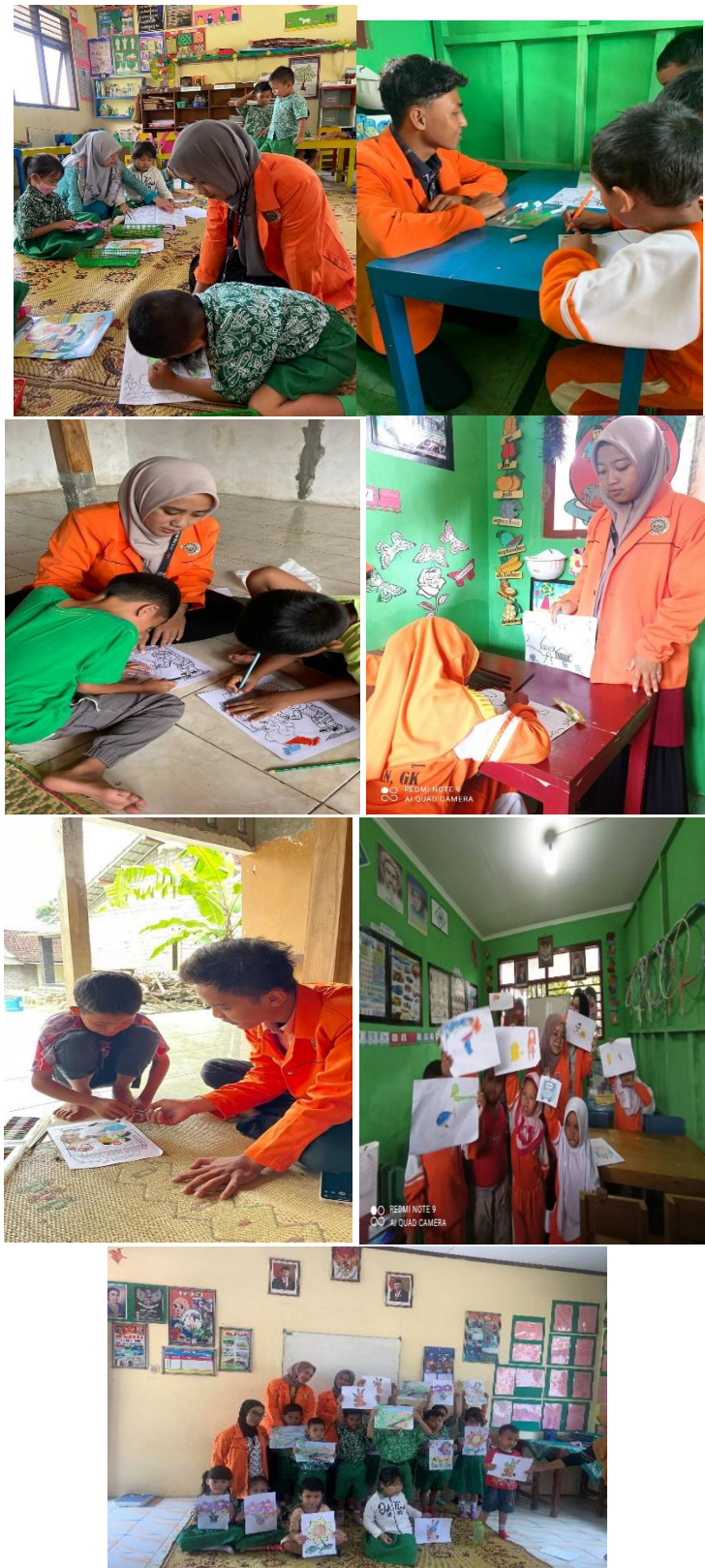
Gambar 3.1 Menggambar dan mewarnai