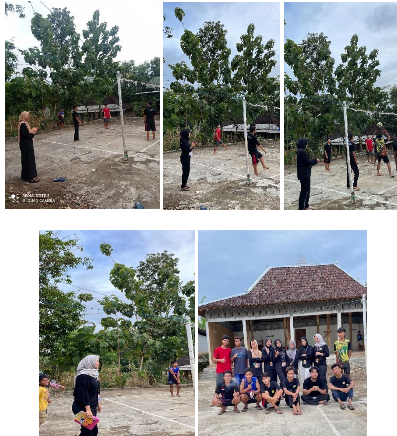
Gambar 3.5 kegiatan keolahraagaan volly