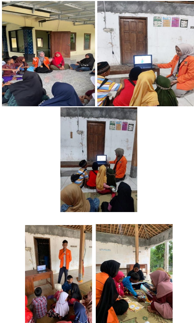
Gambar 2.3 Pembelajaran tentang Nabi, malaikat dan Sifat Wajib Allah