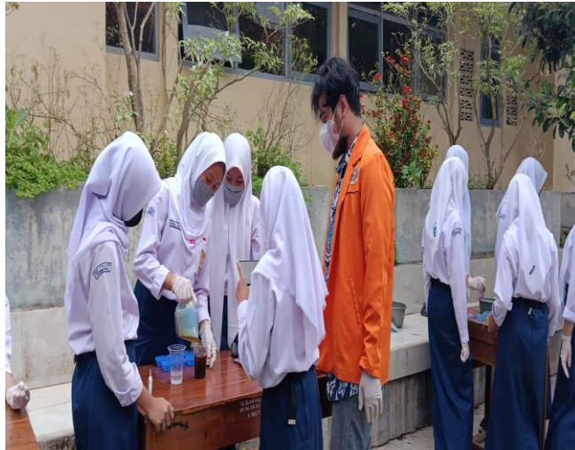
Gambar 1.1 Pembuatan sabun cuci piring