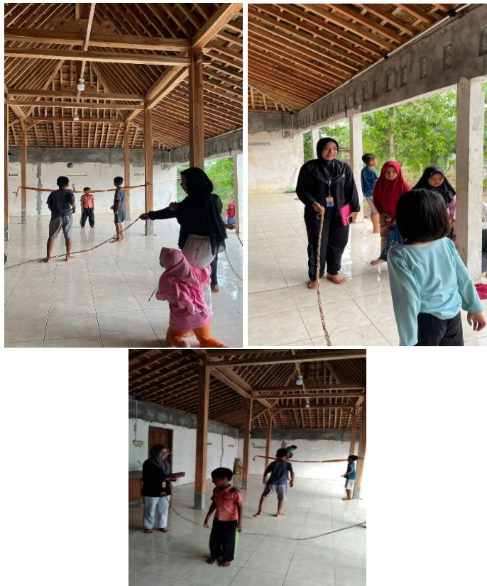
Gambar 3.7 Kegiatan keolahragaan lompat tali