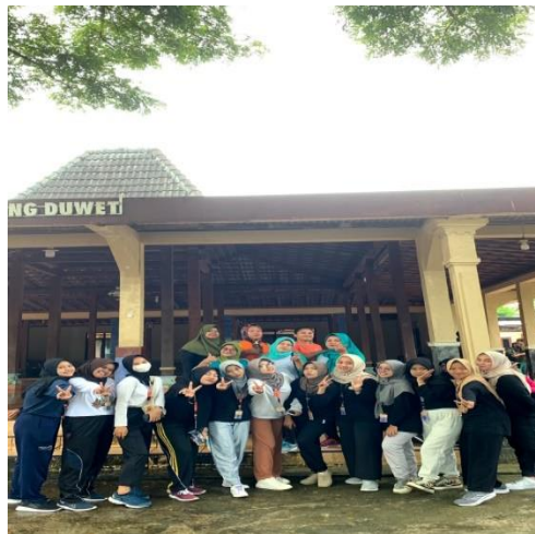
Gambar 3.8 Kegiatan senam Bersama warga dusun corot