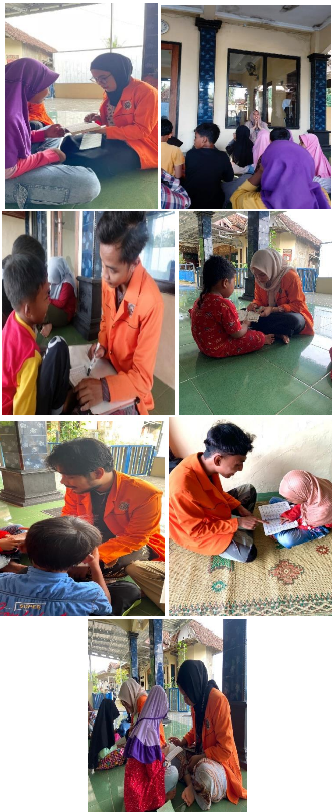
Gambar 2.1 Penyelenggaraan TPA