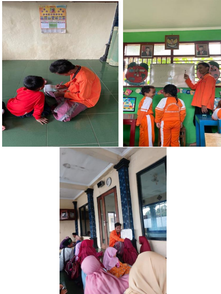
Gambar 1.9 Pelatihan membaca Al-quran