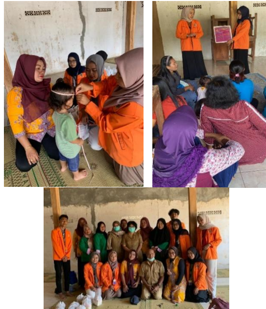
Gambar 4.2 Penyelenggaraan posyandu dan penyuluhan stunting.