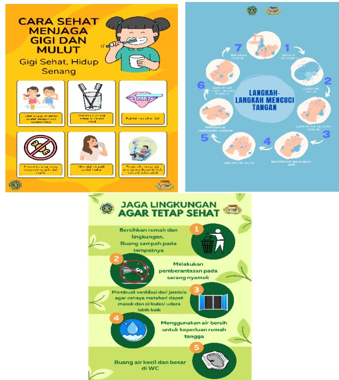
Gambar 1.8 Pembuatan poster tentang Mencuci tangan yang benar, Menjaga Kesehatan Lingkungan dan Kesehatan gigi