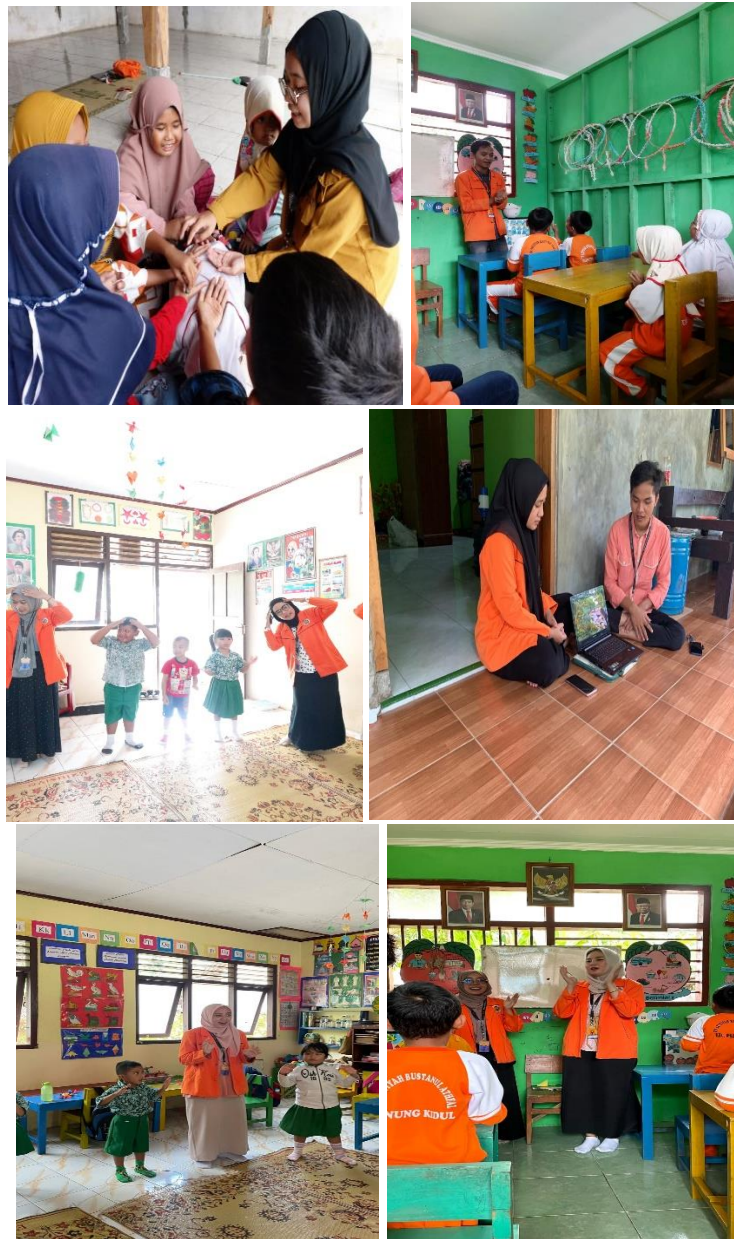
Gambar 3.4 Penayangan video alat musik, hafalan nama lagu daerah, lagu nasional, permainan cublak cublak suweng

Kegiatan keolahragaan ini bertujuan untuk menjaga kebugaran serta semangat anak-anak dan masyarakat agar bisa kesehatan tubuh bisa tetap terjaga terkhususnya anak-anak. Kegiatan olahraga ini diantaranya terdapat olahraga sepak bola, bola volly, senam, lompat tali, skipiing, dan lainnya.