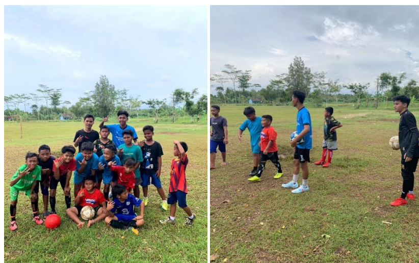
Gambar 3.6 kegiatan keolahraagaan sepak bola