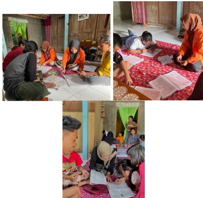
Gambar 4.9 Penyelenggaraan bimbingan belajar

Penyelenggaraan bimbingan belajar oleh peserta KKN UAD unit XXIV.B.3 di Dusun Corot Karangduwet bertujuan untuk membantu mengembangkan dan menggali motivasi belajar siswa/i di dusun corot karangduwet ini. Selain itu penyelenggaraan bimbingan belajar di dusun corot ini bertujuan untuk membantu siswa dalam menyelesaikan tugas - tugas yang diberikan oleh sekolah.