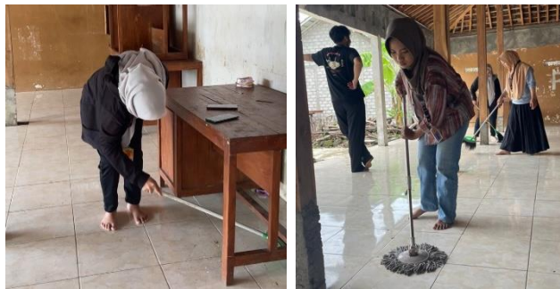
Gambar 4.3 Penyelenggaraan kerja bakti membersihkan lingkungan.