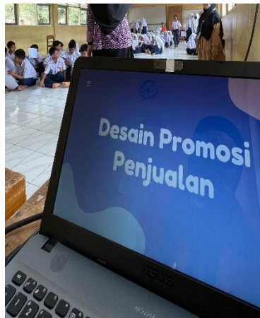
Gambar 1.3 Penyelenggaraan Sosialisasi mengenai Ekonomi