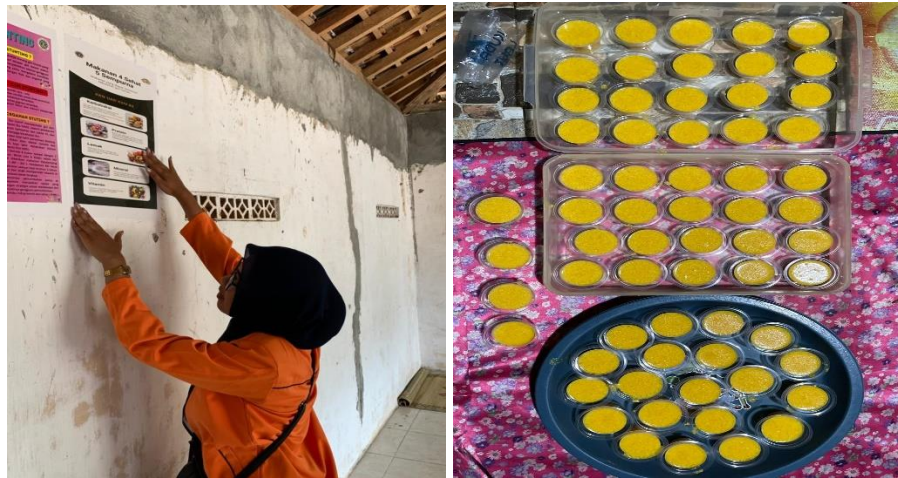
Gambar 1.10 Penyelenggaraan Sosialisai Gizi seimbang