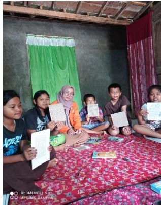
Gambar 1.11 Metode Belajar Matematika Interaktif