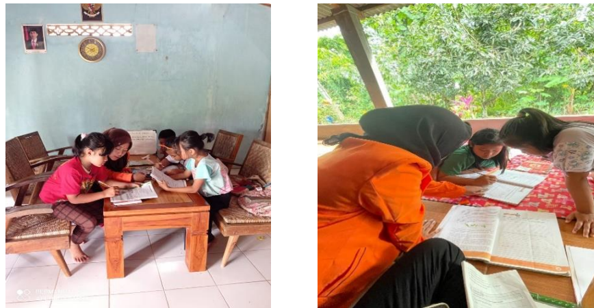
Gambar 1.2 Penyelenggaraan bimbingan belajar