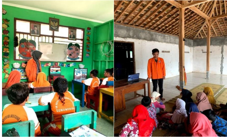
Gambar 2.4 Pembelajaran Adab dan Akhlak melalui Film Omar dan Hana