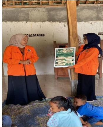
Gambar 1.6 Penyuluhan Tentang Penggunaan Antibiotik

Penyelenggaraan Penyuluhan Tentang Penggunaan Antibiotik dilaksanakan di balai dusun Corot yang bertujuan untuk meningkatkan pengetahuan masyarakat tentang pencegahan resistensi penggunaan obat antibiotik. Oleh karena itu kita harus bijak dalam penggunaan antibiotik.