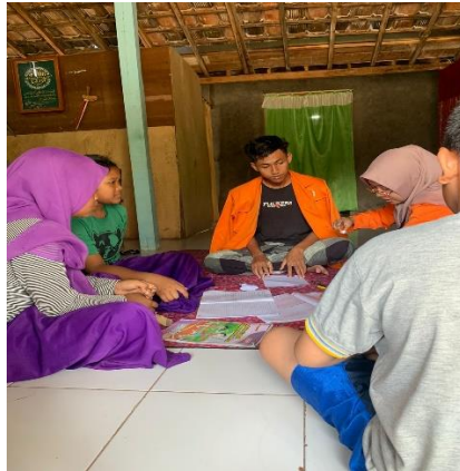
Gambar 1.13 Penyelenggaraan Bimbingan Belajar menghitung