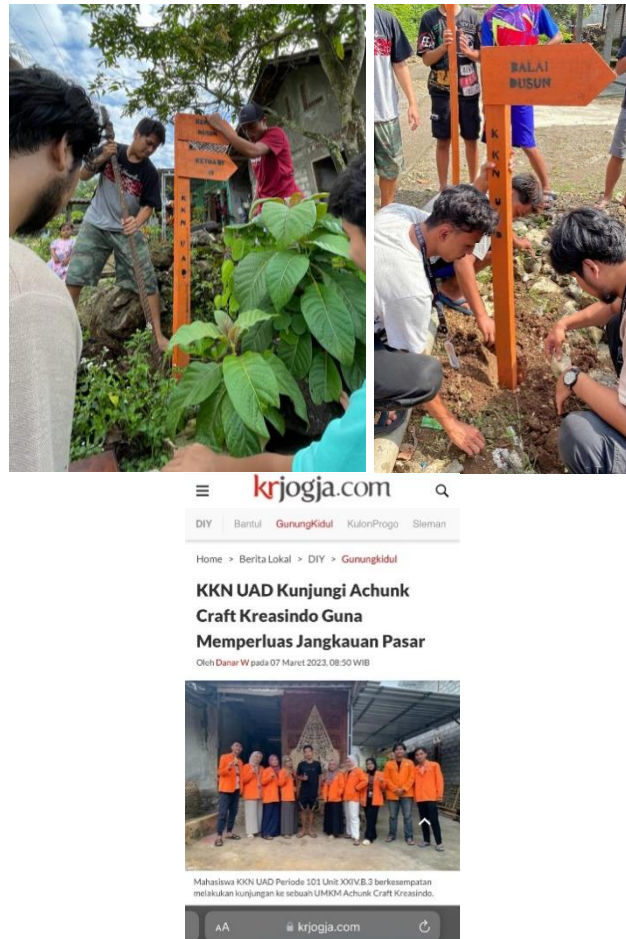
Gambar 4.7 Penyelenggaran luaran program

Program ini yaitu melaksanakan Pembuatan nama struktur kepengurusan, memasang struktur kepengurusan, membuat papan nama RT/RW, dan membuat berita tentang program kerja KKN.