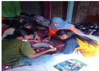
Gambar 1.12 Pembelajaran menggunakan media puzzle

Pelaksanaan kegiatan media pembelajaran puzzle dilaksanakan di posko KKN. Tujuan dari kegiatan ini yaitu melatih kreatifitas dan kemampuan berfikir anak serta meningkatkan rasa kerja sama antar anak-anak.