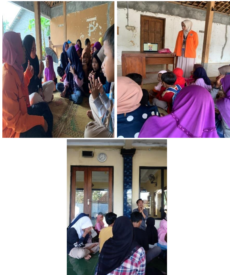
Gambar 2.2 Penyelenggaraan program rukun iman, rukun islam tata cara berwudhu, tayamum dan thoharoh

Penyelenggaraan kegiatan ini bertujuan untuk menambah wawasan dan pengetahuan kepada anak-anak dusun Corot tentang rukun iman, rukun islam, tata cara wudhu dan thoharoh sehingga bisa dipraktekkan untuk kehidupan anak-anak.