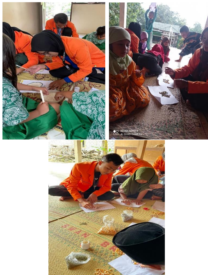
Gambar 3.3 Kolase