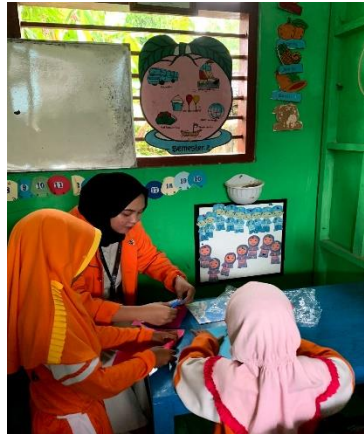
Gambar 3.2 Origami