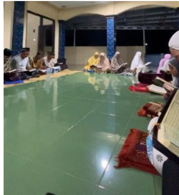
Gambar 4.5 Penyelenggaraan pengajian dan ceramah