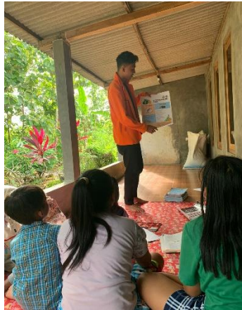
Gambar 1.4 Penyuluhan pentingnya menabung, pengenalan mata uang dan bahaya pinjaman online