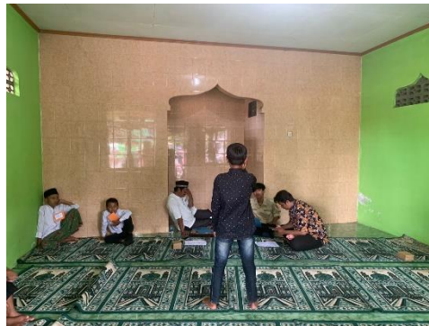
Gambar 4.10 Pendampingan festival anak sholeh dusun corot