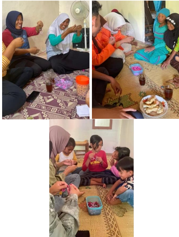
Gambar 4.4 Penyelenggaraan pendampingan umkm membuat manik-manik