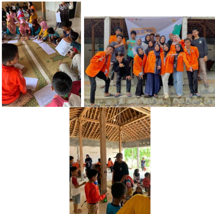
Gambar 4.6 Penyelenggaraan lomba keislaman di TPA

Lomba semarak peringatan Isra Mi'raj atau lomba anak sholeh digelar di Masjid al – ikhlas yang diikuti oleh anak – anak dari padukuhan Corot dan sekitarnya. KKN UAD XXIV.B.3 berkolaborasi dengan remaja masjid. Lomba yang dilaksanakan yaitu lomba mewarnai, lomba hafalan surat dan lomba lato – lato.