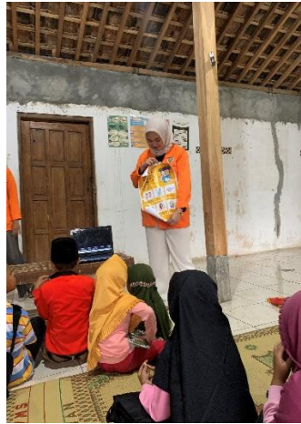
Gambar 1.14 penyuluhan tentang kesehatan lingkungan, kesehatan gigi dan mencuci tangan yang benar

B. Bidang Keagamaan yang dilaksanakan oleh mahasiswa KKN Reguler 101 Unit XXIV.B.3 terbagI dalam beberapa program yaitu :