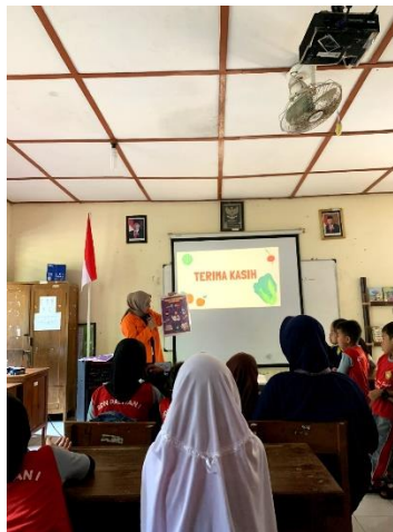
Gambar 1.7 Penyuluhan tentang bentuk sediaan obat

Penyelenggaraan Penyuluhan tentang bentuk sediaan obat dilaksanakan di SDN 1 Paliyan. Kegiatan ini bertujuan untuk memperkenalkan bentuk-bentuk sediaan obat dan cara penggunaan obat-obatan kepada anak-anak.