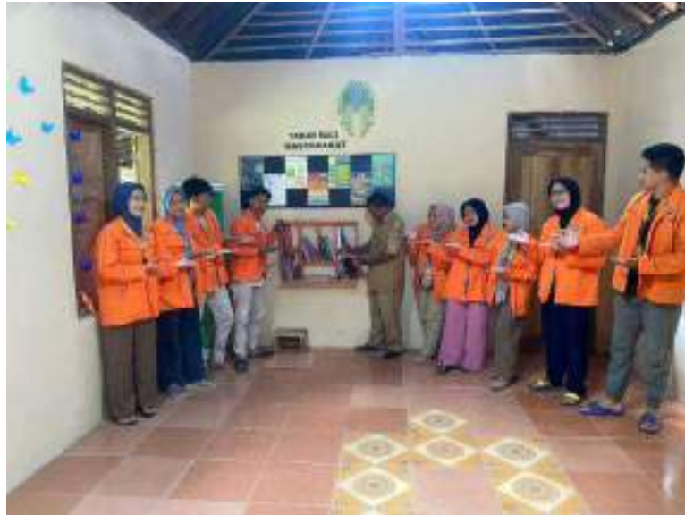
Gambar 1. Foto penyerahan kegiatan Pojok Baca Dusun Plembutan Barat

Target luaran dari kegiatan Pojok Baca ini adalah publikasi berita di Web desa Plembutan. Berita kegiatan ini dapat diakses melalui link: