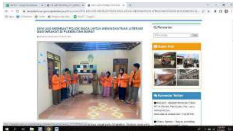
Gambar 2. Publikasi berita kegiatan Pojok Baca Dusun Plembutan Barat

Bukti luaran kegiatan Pojok Baca di Dusun Plembutan Barat dapat dilihat pada gambar 2.