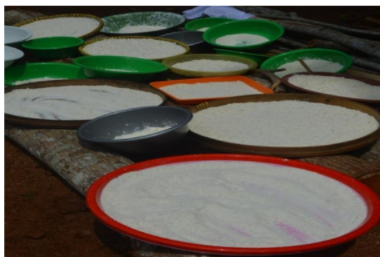
Gambar 3. Hasil Olahan Singkong Menjadi Tepung Gaplek

Pelatihan pengolahan singkong menjadi tepung gaplek dapat berjalan dengan baik. Masyarakat dapat mengetahui proses pembuatan tepung gaplek dan memiliki keterampilan dalam mengolah singkong, salah satu potensi alam di Pengkok. Tepung gaplek yang dihasilkan memiliki warna yang putih (Gambar 3) sehingga relatif lebih mudah untuk diolah menjadi aneka olahan pangan.