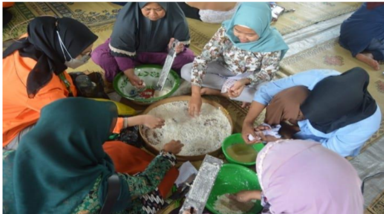
Gambar 1. Pelatihan Pembuatan Tepung Gaplek

Pengabdian yang dilakukan terdiri atas 2 kegiatan yaitu penyuluhan dan pelatihan pembuatan tepung gaplek (Gambar 1). Pelaksanaan dilakukan pada tanggal 3 September 2022 di Balai Kalurahan Desa Pengkok, Kecamatan Patuk, Kabupaten Gunung Kidul. Pemateri untuk program ini yaitu dari tim pelaksana program. Pelatihan ini ditujukan untuk meningkatkan pengetahuan mitra tentang pembuatan tepung gaplek.