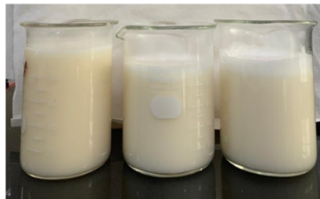
Gambar 5. Hasil produk dari rancangan SOP akhir