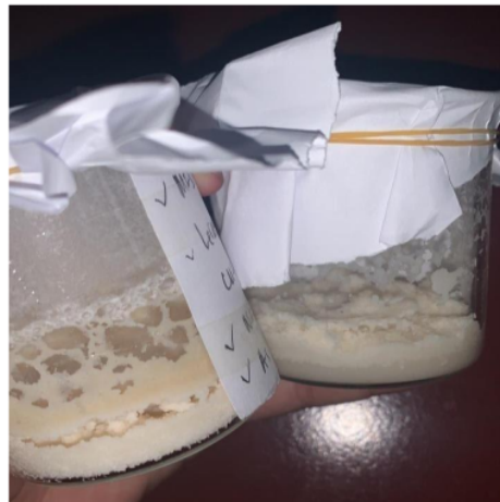
Gambar 2. Hasil produk dari rancangan SOP awal